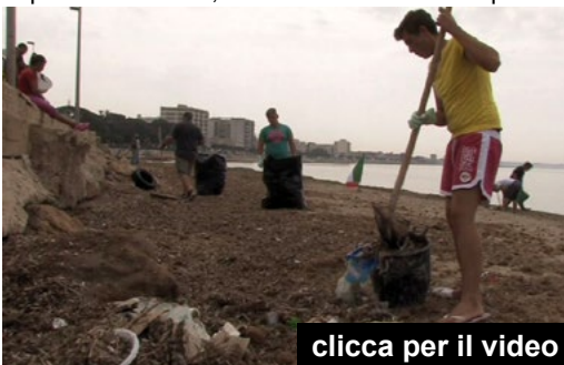
clicca per il video

a vivere, dove c'erano rifiuti a valanga oggi si può fare persino il bagno perché le acque del lungomare adesso sono balneabili; sono stati resi noti i dati della società regionale chiamata a fare le analisi, ci sono zero elementi inquinanti