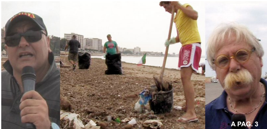
■ A PAG. 3