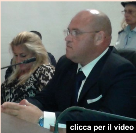
clicca per il video

l'accusa che è stata rivolta alla mia presidenza, per la verità da un solo consigliere comunale, ma poi ripresa ed amplificata da media e social network, di avere condotto i lavori in maniera non