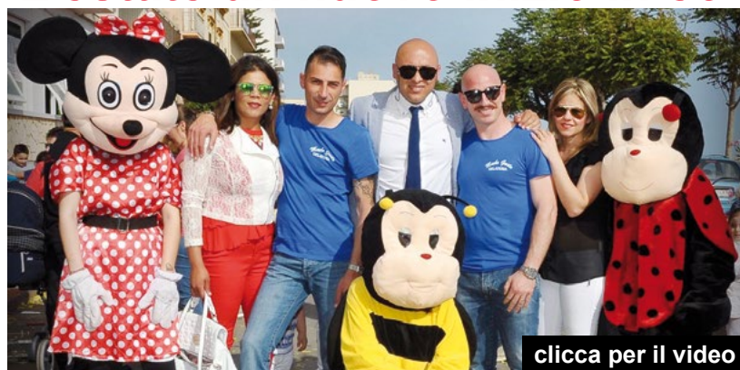
clicca per il video