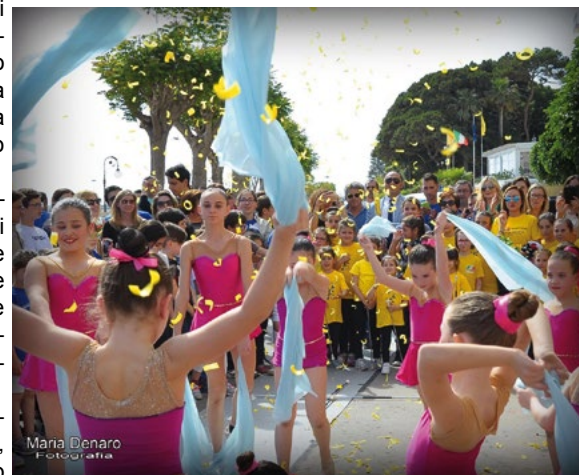
Maria Denaro Fotografia