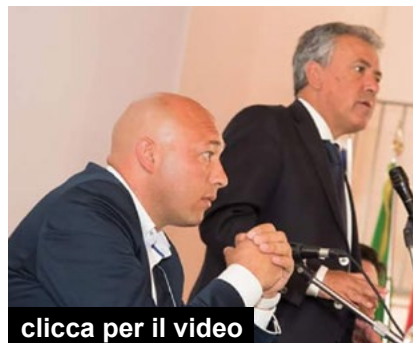
clicca per il video