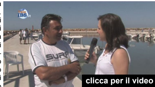
clicca per il video

riuscita a mettere in pratica quella che era la nostra idea di porto turistico che ha avuto un costo di circa 500 mila euro circa, in questo progetto ogni socio ha messo del suo cercando di risparmiare come farebbe un buon padre di famiglia. L'Associazione conta oltre 200 soci, abbiamo 140 posti barca e gli assegnatari