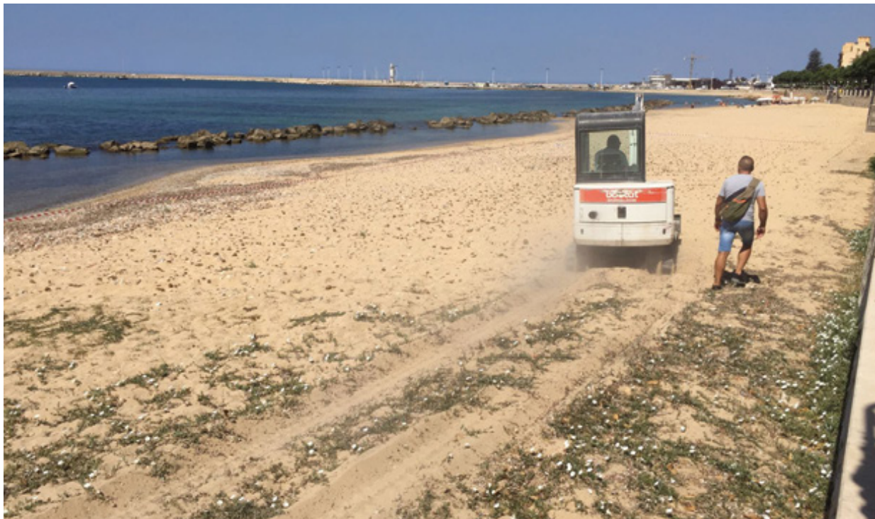
■ A PAG. 3