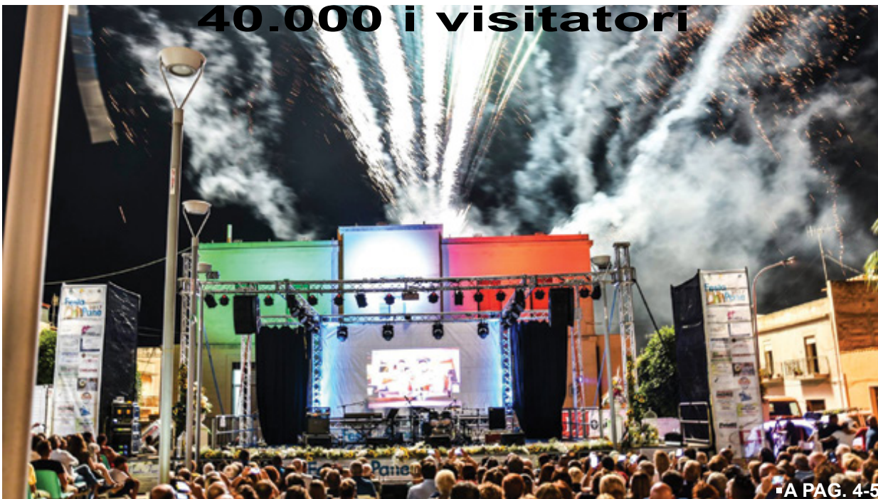
■ A PAG. 4-5