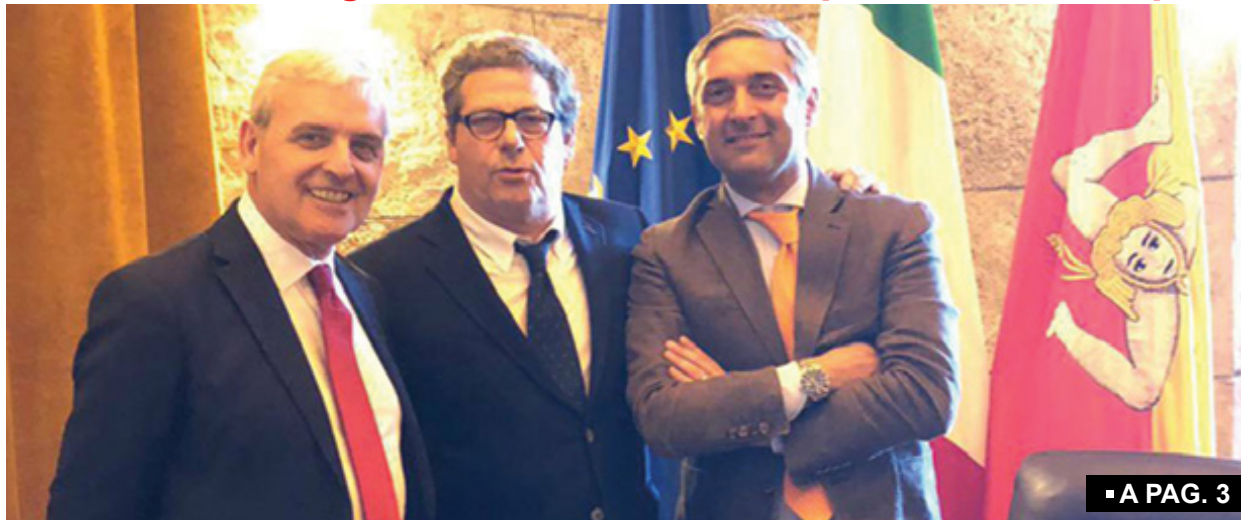
▪ A PAG. 3