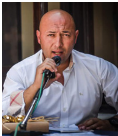
▪ A PAG. 6