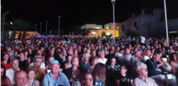
Festa del Pane e della Pasta

ma un flop sotto ogni punto di vista. Altra manifestazione che ha destato interesse è lo storico, intramontabile e irrinunciabile per ogni mazarese: "Il Festino di San Vito". Una sei giorni ricca di eventi, da quelli storici come