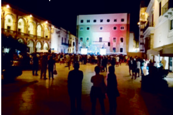
Oscar dello sport

ma un flop sotto ogni punto di vista. Altra manifestazione che ha destato interesse è lo storico, intramontabile e irrinunciabile per ogni mazarese: "Il Festino di San Vito". Una sei giorni ricca di eventi, da quelli storici come