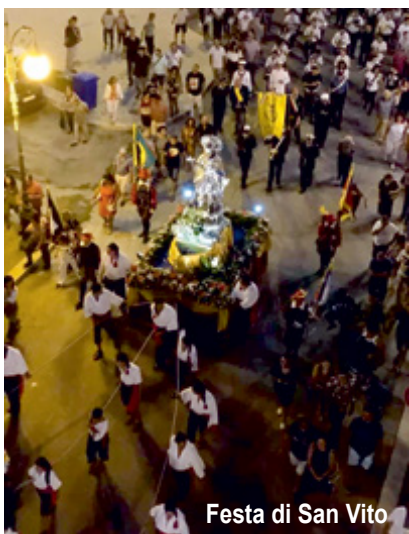
Festa di San Vito