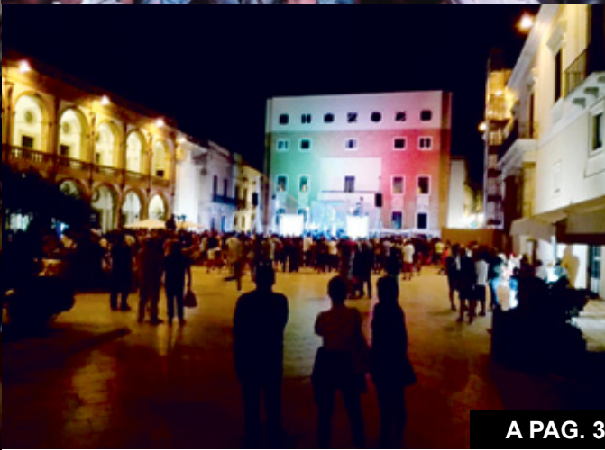
A PAG. 3