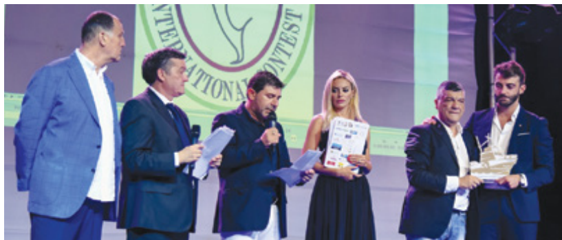
▪ A PAG. 6