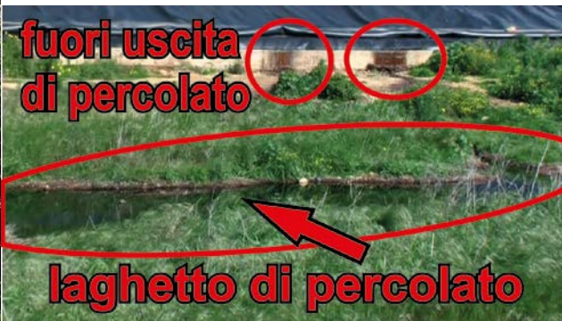
fuori uscita di percolato