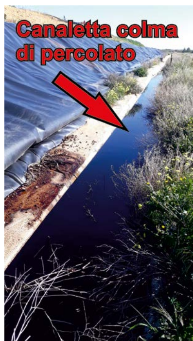
Canaletta colma di percolato