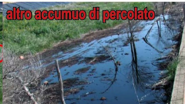
altro accumulo di percolato