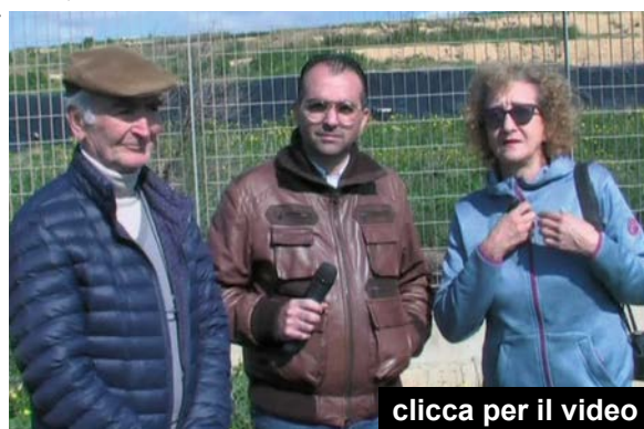
clicca per il video