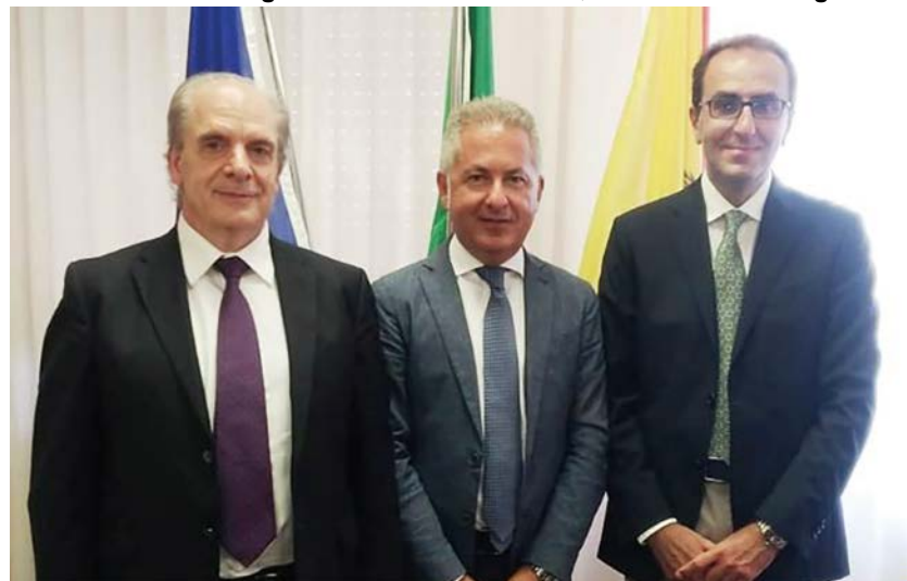
Direzione strategica A.S.P. Trapani

dal 1° Gennaio 2017. Successivamente n.513 dipendenti con la busta paga del mese di Aprile 2019, a decorrere dal 1° gennaio