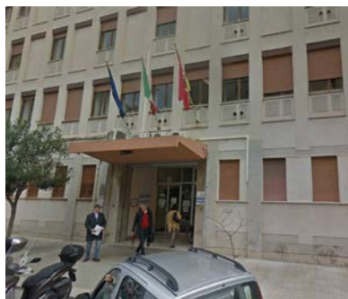
di Baldo Scaturro

Grande soddisfazione del Sindacato degli Infermieri 45.000,00 Euro per n.61 dipendenti dell'A.S.P. con arretrati dal 1 gennaio 2018