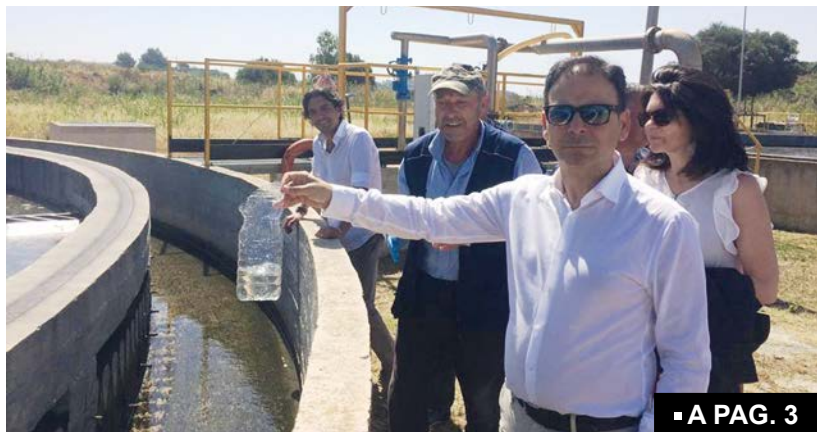
■ A PAG. 3