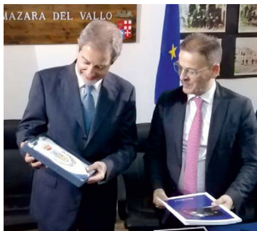
Nello Musumeci Governatore della Regione Sicilia e Salvatore Quinci Sindaco di Mazara del Vallo

voli benefici anche per le condizioni di navigabilità del fiume: l'ingresso, il transito e le manovre di ormeggio delle navi potranno essere finalmente effettuate in condizioni di massima sicurezza. Il progetto prevede anche il prelievo tutti i materiali giacenti sui fondali: cavi di acciaio, reti da pesca, sartiame, cavi di diversa natura, copertoni in gomma, legno, vetro, plastica, batterie esauste. La profondità dell'acqua sarà portata a tre metri a partire dal ponte e fino al mercato del pesce, a quattro metri fino a piazzale Quinci e a sei metri per l'intero bacino di ponente e fino all'imboccatura del porto, per una superficie di circa 180 mila metri quadrati. Il progetto denominato "lavori di ripristino dei fondali del bacino portuale e del retrostante porto canale - 1° stralcio - Foce del Fiume Mazaro" riguarda la foce del fiume Mazaro, infatti questo rappresenterebbe soltanto il primo step di tutto il progetto di dragaggio del fiume per il quale sono stati stanziati