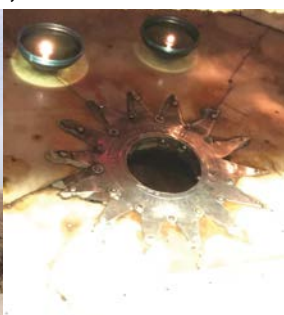
Basilica della Natività Betlemme