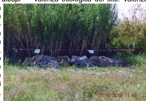
Reti da pesca abbancate tra i canneti della sponda nord della Laguna, sottoposte a sequestro dalla Capitaneria di Porto.

Chi ha la "coda di paglia" o comunica sui social per partito preso, evidentemente, evita di partecipare alle visite dimostrative della straordinaria valenza ecologica del sito. Valenza