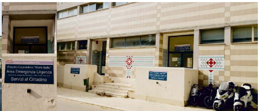
Ex Area di Emergenza - Urgenza - All'interno n.2 Guardie Mediche ubicate senza indicazione di segnaletica