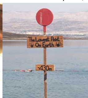
Mar Morto (o Mare del Sole) Si trova a meno 430 metri sotto il livello del Mare - Gerusalemme