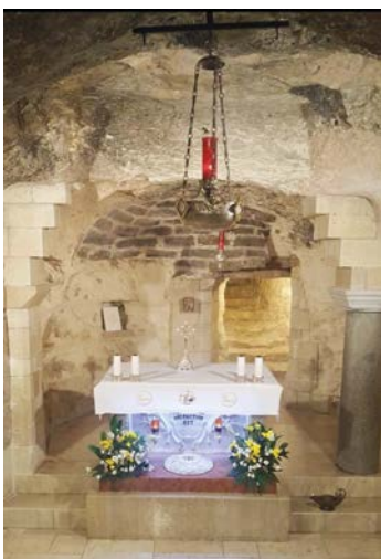
Grotta dell'Annunciazione a Nazaret

in lungo e in largo Israele e Palestina senza sosta, per cercare di vedere tutto quello che prevedeva il programma. È stato interessante mescolarsi con persone di età e città diverse, con gente sconosciuta, ma allo stesso tempo legata da una fede incrollabile e da una vitalità provocante: molto forte è stato il nostro stare in preghiera al muro del pianto.