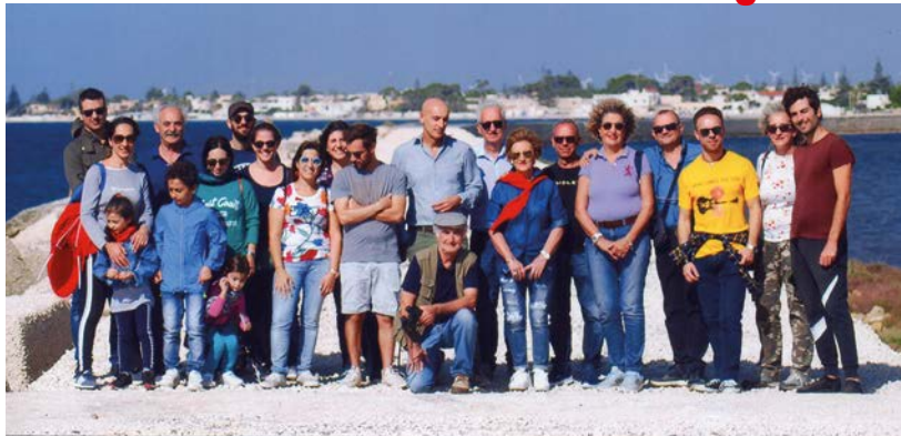
Un gruppo di visitatori alla Laguna di Tonnarella.

M azara del Vallo, il 20 ottobre scorso, è stata impegnata dalla manifestazione Blue Sea Land e da una gara di karting che sicuramente hanno distratto la popolazione dalla visita istruttiva, organizzata dall'Ass. ne Pro Capo Feto – Federazione Nazionale Pro Natura per illustrare le qualità naturalistiche e paesaggistiche del "biotopo" Laguna di Tonnarella, ex Colmata B. Un buon numero di cittadini è, comunque, accorso all'invito dell'Ass.ne che, oltre a dimostrare la straordinaria valenza ecologica del sito, in maniera chiara e netta, ha spiegato i motivi per i quali l'ex Colmata è biotopo, ovvero laguna ricca di cenosi settoriali. A Mazara, c'è infatti chi mette in dubbio la tipologia