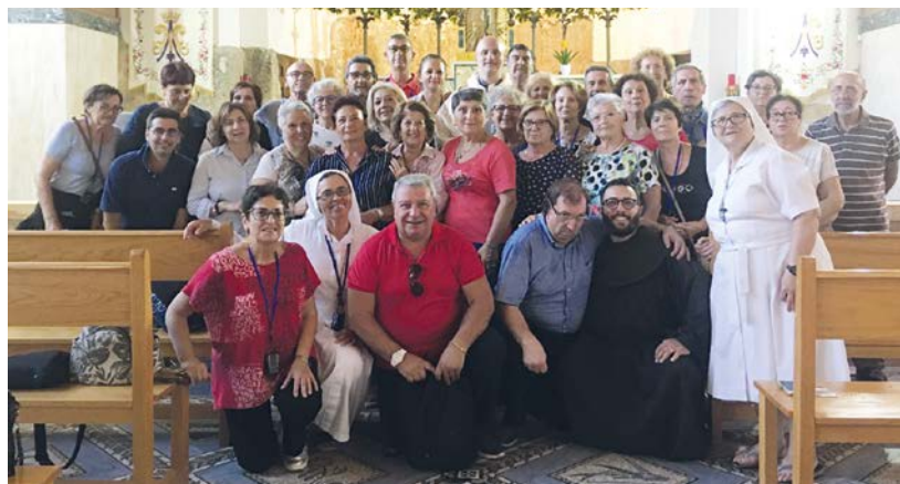
Foto di gruppo ad Ain Karem

Ogni luogo visitato è stato un tassello fondamentale e significativo di questo pellegrinaggio durante il quale abbiamo avuto davvero l'opportunità di compiere "insieme" un cammino, non solo metaforico. Siamo passati, in maniera repentina, dalla tranquillità del Lago di Tiberiade all'aridità del deserto; dal muro d'ingresso presidiato dai militari di Betlemme alle mille sfaccettature di Gerusalemme: ogni sito visitato veniva ad interrogarci in merito al nostro essere cristiani. Siamo stati interpellati a riappropriarci, in maniera adulta e consapevole, della nostra fede. Quella di Israele è una terra ricca di bellezza, di fascino, di contraddizioni e di contrasti (naturali, politici, sociali e religiosi), ma nella sua complessità è una terra che ci parla di Dio che è Padre e di Gesù che si è fatto uomo come noi; che vuole incontrarci e chiamar-