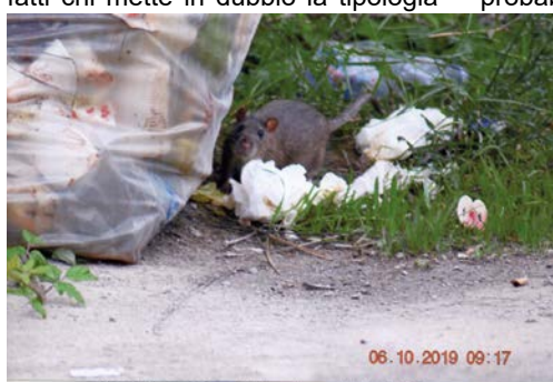
Sacco d'immondizia e ratto lungo il muro di cinta della Laguna in prossimità della Soprelevata.

di laguna della zona umida e c'è, in particolare, un personaggio che vorrebbe far credere alla cittadinanza che il luogo non è un "Callitopo" (bel luogo sotto il profilo paesaggistico), ma piuttosto un Cacotopo (brutto luogo). Non tutti sanno, però, che il personaggio è lo stesso che avrebbe