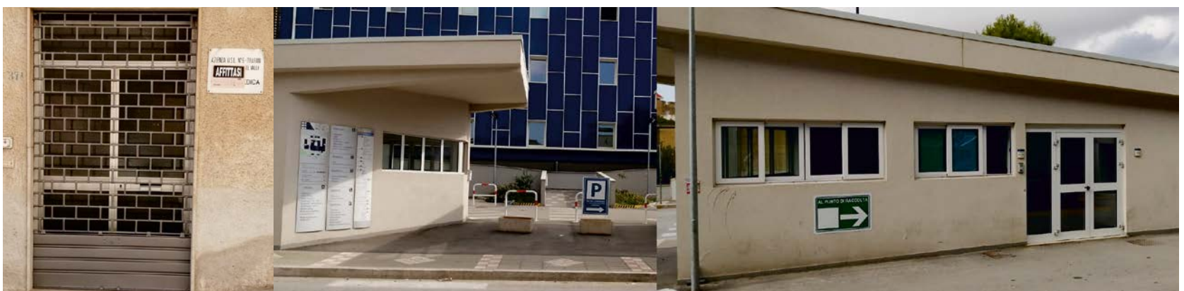
Ex Guardie Medica di Via Leonardo Bonanno n37 (Trasmazaro) ancora con l'insegna muraria affissa Ingresso dei visitatori di accesso e di uscita con l'immobile della portineria centrale di Via Salemi senza visibilità dell'addetto in servizio alla portineria