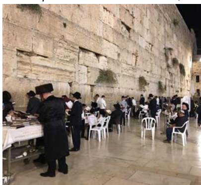
Muro del Pianto