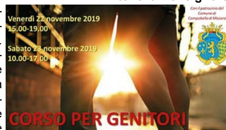
CORSO PER GENITORI