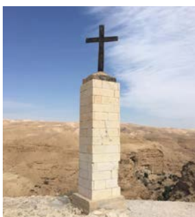
Wadi Kelt deserto Giordania

La Terra Santa è stata un'esperienza assolutamente arricchente ed inattesa, non solo per le emozioni vissute ma per l'incontro con ognuno dei partecipanti. Al momento dei saluti molti avevano gli occhi inumiditi dalla commozione. Se dunque ci si è trovati davvero uniti nel camminare insieme, nella preghiera, nelle celebrazioni liturgiche, nell'abbraccio fraterno (parliamo di 44 persone che fino alla partenza molti non si conoscevano o ci si conosceva appena), allora si può davvero affermare che abbiamo incontrato il Signore. Senza accorgercene, tante volte, in questi giorni ci è stato fianco a fianco sulle stesse strade che Lui aveva percorso fino a Gerusalemme dove tutto si è compiuto e dove tutto ha avuto un nuovo inizio. Portiamo con noi la speranza di non dimenticare troppo presto l'atmosfera che quest'esperienza ci ha regalato: portiamo con noi il desiderio, la voglia di riconoscere ed affrontare i nostri limiti; portiamo con noi la consapevolezza che la chiesa viva era tutta lì in mezzo a noi... eravamo noi.