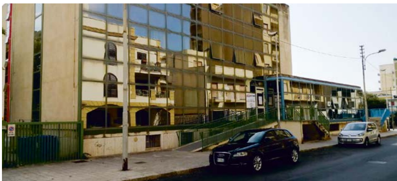
Distretto Sanitario di Mazara del Vallo