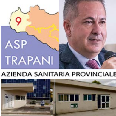
di Baldo Scaturro ▪ A PAG. 4

MAZARA DEL VALLO Potenziato l'Ufficio Legale dell'Azienda- In scadenza n.490 contratti di operatori sanitari