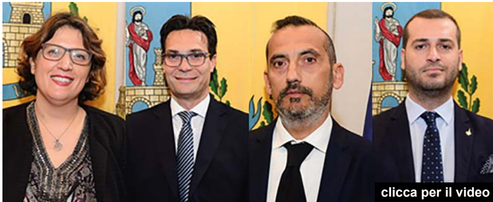
clicca per il video

Riassumendo ciò che è stato detto, per Billardello le porte non sono ancora aperte ma si discute per aprirle, c'è la volontà di aprirle quello che non si capisce se la discussione riguarda il modo e i tempi con cui questo debba avvenire o se la discussione si è arenata nelle posizioni di qualche irriducibile che continua a opporsi a questo rientro, mentre il nuovo gruppo non è un'alleanza, non ci sono accordi per future elezioni c'è solo la volontà di creare un'opposizione più decisa e forte nelle sue azioni e devo dire che nell'ultimo Consiglio Comunale al primo banco di prova di questa teoria si è espressa e mostrata con dirimpenna, mettendo non in difficoltà la folta maggioranza ma addirittura battendola, costringendola a cedere una posizione nelle commissioni consiliari permanenti, di questo potrete leggere in maniera più dettagliata nell'altro mio articolo dal titolo "Le poltrone non bastano mai".