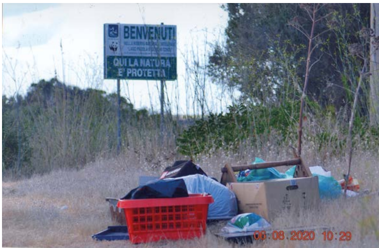
Ben si comprende che è inciviltà di massa. E' inconcepibile però che gli ambientalisti mazaresi si soffermino solo sui rifiuti accatastati a Capo Feto.

le loro responsabilità. La Regione, infatti, in assenza di un gestore della ZPS o della ZSC rimane la maggiore responsabile dell'area protetta di Capo Feto. La stessa Regione, per scaricarsi in parte di responsabilità, avrebbe dovuto nominare un gestore entro 180 gg. dall'istituzione della ZPS (anno 2000) o entro 180 gg. dal passaggio del proposto SIC a ZSC, come da Decreto del 31/3/2017, ma non ha fatto neanche questo. Nei circa 8 Km. di litorale della ZSC e ZPS ITA010006 "Paludi di Capo Feto e Margi Spano", la balneazione è possibile, ma va consentita nei tratti di spiaggia in cui l'impatto non risulta significativo. A Capo Feto per arrivare sulla spiaggia bisogna percorrere una stradina che a destra e a manca confina con canali e gorghe, sempre allagati, in cui si riproducono e stazionano uccelli migratori e stanziali. Uccelli la cui presenza sarebbe molto più cospicua se ci fosse un gestore consapevole o se la Regione attuasse, comunque, una seria politica di gestione del patrimonio naturale. Alle spalle della spiaggia, a non volere considerare l'impatto esercitato sulla stessa, ci stanno altri habitat palustri sempre con uccelli che se lasciati in pace, per la varietà