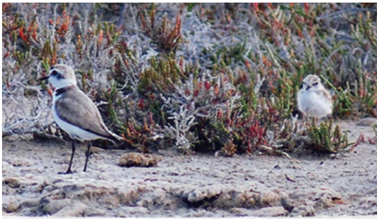
Chiocchia di Fratino con il pulcino alle spalle della spiaggia di Capo Feto.

e l'abbondanza, richiamerebbero visitatori da tutta Europa. Aspirare alla gestione di Capo Feto per cercare di avere un'entrata economica certa e garantita, come attualmente avviene a prescindere in buona parte delle riserve siciliane, gioverà a politici e a galoppini, ma non gioverà mai alla tutela e alla conservazione di quel bene supremo di tutti che è il patrimonio naturale.