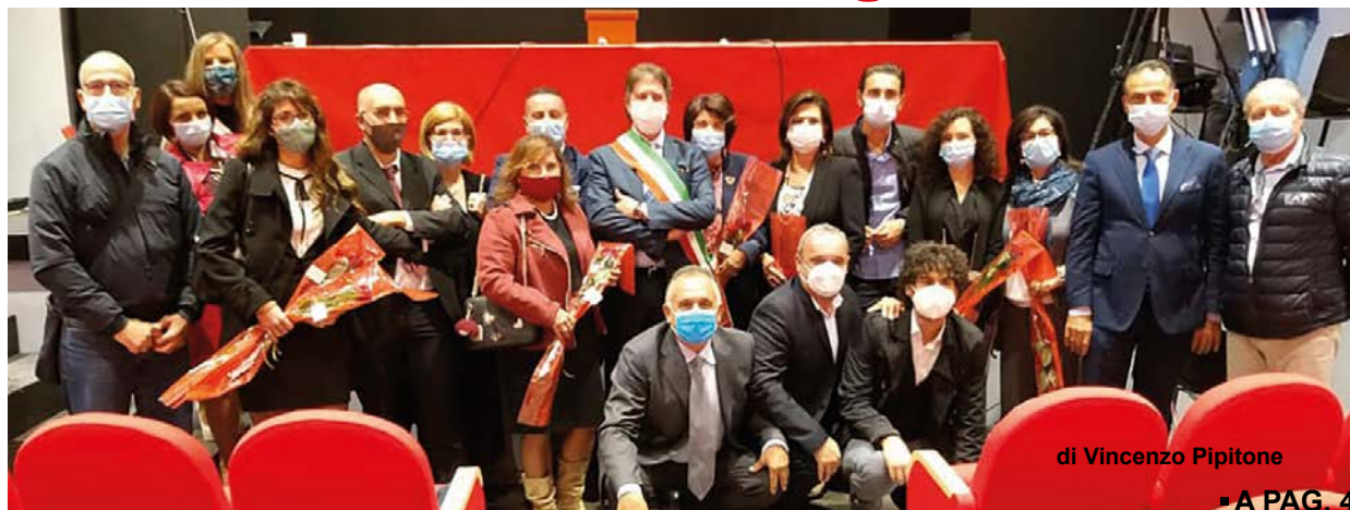
di Vincenzo Pipitone