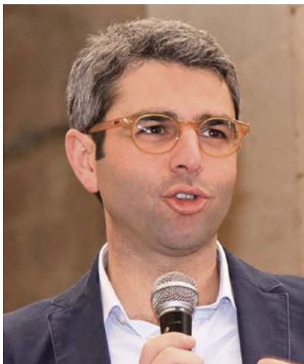
Domenico Venuti, sindaco di Salemi

misure di contrasto alla crisi economica figlia dell'epidemia da Covid-19: l'Amministrazione ha programmato la spesa dei circa 970mila euro che è riuscita a ottenere dallo Stato e dalla Regione come ristoro economico per i mesi in cui Salemi è stata 'zona rossa'.