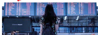
di Melania Catalano ■ A PAG. 10