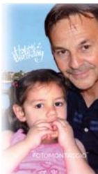
di Vincenzo Pipitone ■ A PAG. 7