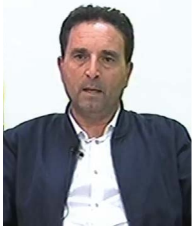
La Redazione ■ A PAG. 5