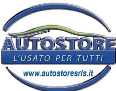
■ A PAG. 12