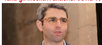
di Franco Lo Re ■ A PAG. 9