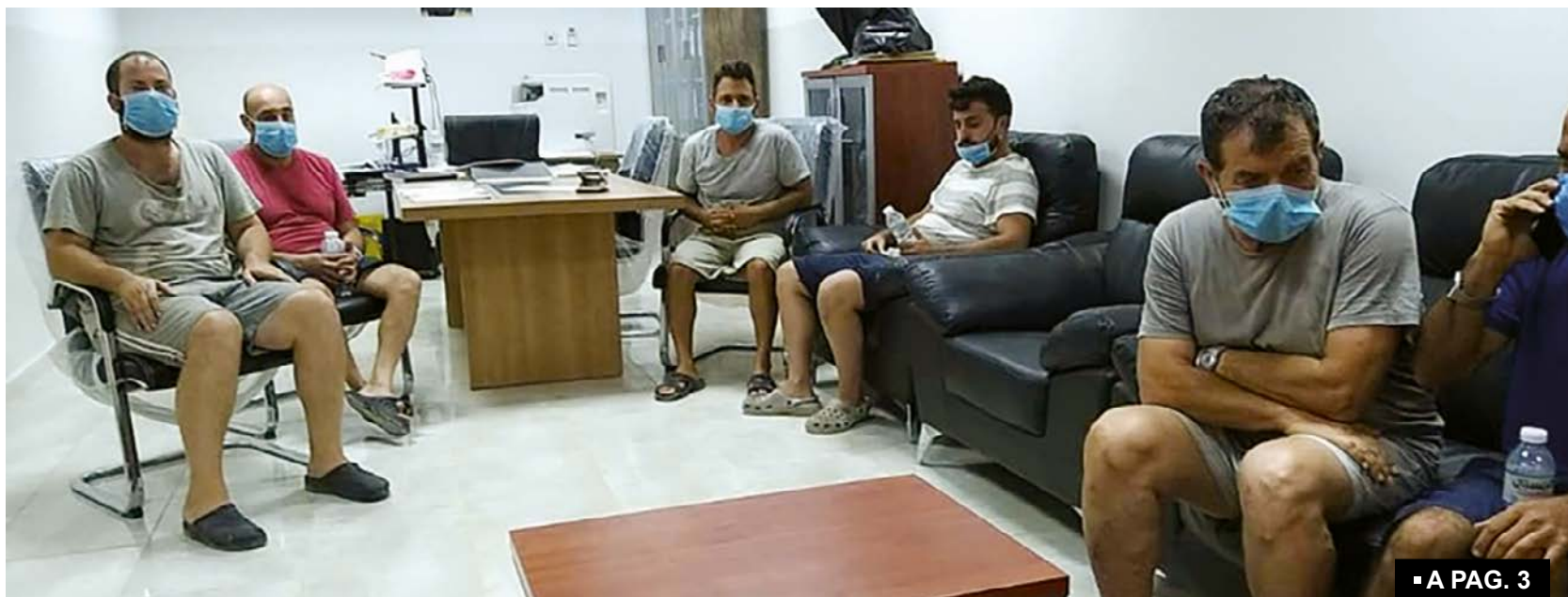
■ A PAG. 3