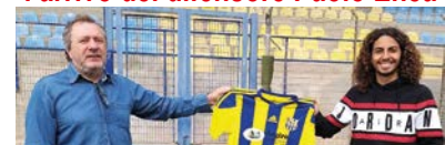
■ A PAG. 11