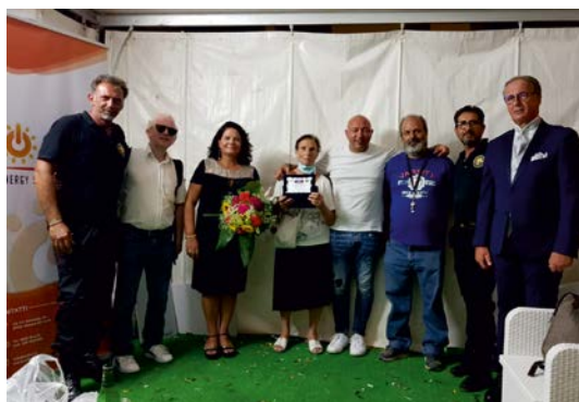
Targa in memoria di Rolando Certa