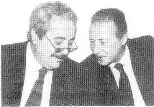
GIOVANNI FALCONE E PAOLO BORSELLINO: DUE MAGISTRATI SICILIANI CRESCIUTI INSIEME, MARTIRI IMPEGNATI E CADUTI INSIEME NELLA STESSA LOTTA CONTRO LA MAFIA.

1) La Mafia esiste in tutta la Sicilia, la mafia esiste anche a Trapani!. Da quelle due stragi la mafia inizia a perdere, ma è tutt'altro che sconfitta.