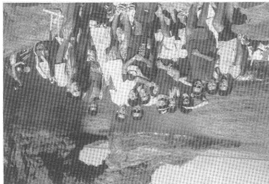
Alcuni giovani al campeggio di Panelleria