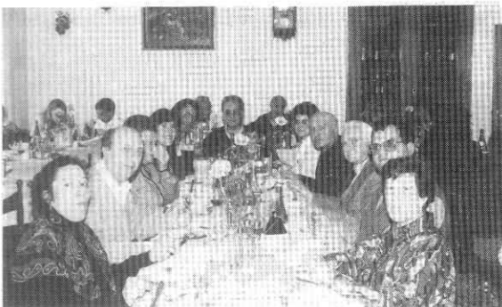
A Montecatini al Convegno Nazionale delle C.E.B.