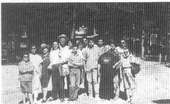
Sulle Madonie con i Giovani