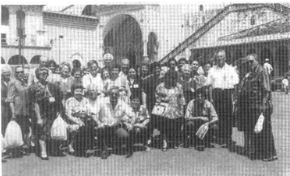
... nei luoghi francescani di Assisi.