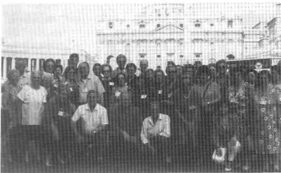
Con gli adulti a Roma e