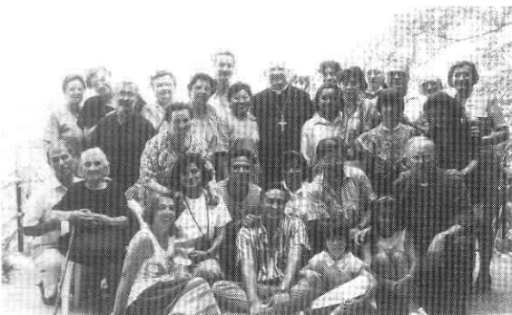
Ad Erice al Primo Corso Residenziale Diocesano dell'Ecumenismo e Dialogo