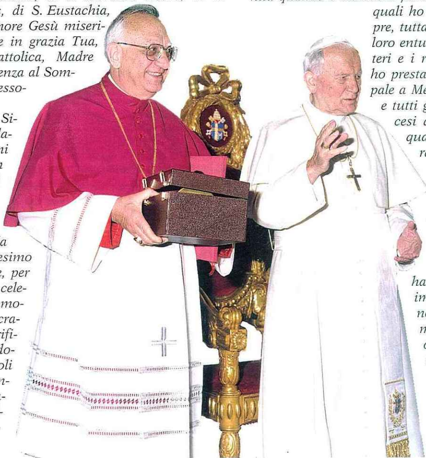
S.E. Mons. Domenico Amoroso riceve dal Papa un "calice", segno di quello che lui berrà, con la sua sofferenza fino alla morte.

Ti sono grato infine, o Signore Gesù, per avermi messo a contatto con gente di quasi tutte le nazioni del mondo che mi hanno aperto il cuore e la mente e per quello che le Chiese che ho particolarmente