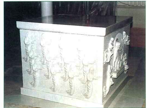
Il nuovo altare che sarà consacrato il 24 ottobre, Solennità della Dedicazione della Cattedrale, alle ore 18.30

Invitiamo gli Enti, le Banche e tutti i fedeli a dare un contributo generoso da versare all'Ufficio Parrocchiale della Cattedrale o sul C.C.P. 12117917 intestato alla Parrocchia S. Lorenzo o nella busta, acclusa nella "Lettera Aperta" di Pasqua n. 182, da riconsegnare, in Cattedrale, per togliere il debito al 12 Ottobre 1997 di L. 68.502.859