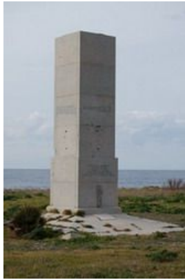
la stele di Anchise a Pizzolungo