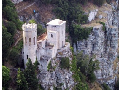
Erice: Torretta Pepoloi