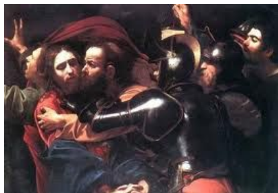
Caravaggio: il bacio di Giuda