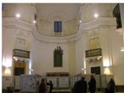
Chiesa di S. Alberto, sede della Mo-