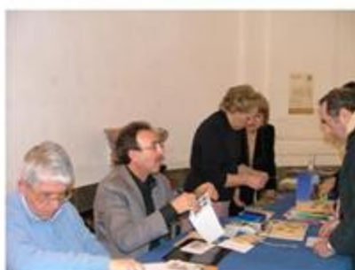
Lo Staff filatelico di Poste Italiane e le Hostess della Scuola

SONO GRADITE LE PARTECIPAZIONI DEGLI APPASSIONATI, ANCHE NON SOCI PER SCAMBI DI IDEE O INFORMAZIONI.