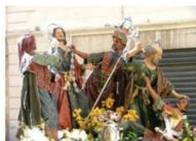
IV Gruppo ripreso durante la tradizionale "Processione dei Mistri"

Nel corso della Mostra è stato anche presentato il primo numero della pubblicazione periodica del Circolo "MONDO FILATELICO"