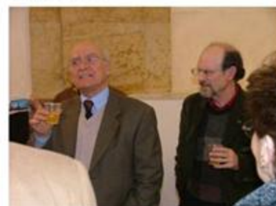
Brindisi inaugurale della esposi-