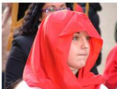
Fedele al seguito della Processione