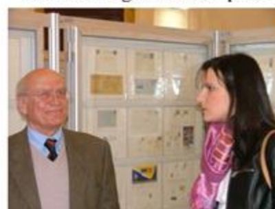
Onori di casa del Presidente del

I SOCI DEL CIRCOLO SI RIUNISCONO LA PRIMA E LA TERZA DOMENICA DI CIASCUN MESE DALLE ORE 10 ALLE ORE 12, NELLA SEDE PROVVISORIA DI VICOLO RALLO N.3