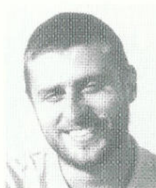
Gaspare Occhipinti Libertà per Paceco