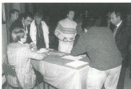
Raccolta firme per il Comune Regalbesi