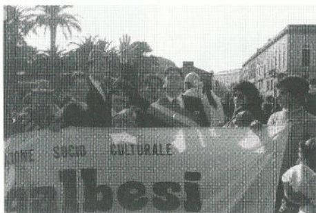
Regalbesi è anche divertimento