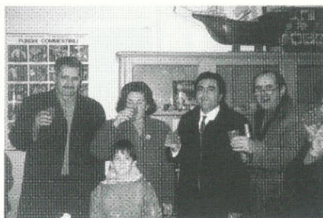
Brindisi regalbesino: è nata la cooperativa femminile dell'artigianato