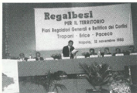
L'impegno dell'Associazione per la rettifica dei confini