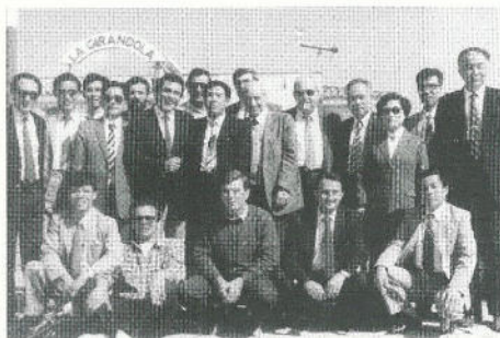
Uno sguardo all'Est. Regalbesi incontra una delegazione economica cinese