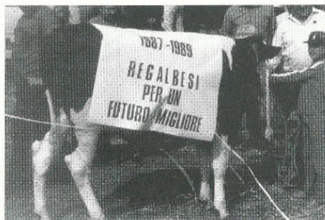
Regalbesi per l'economia: decolla la Mostra Mercato del Bestiame