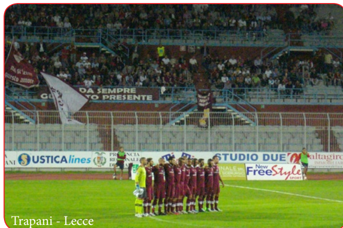
Trapani - Lecce