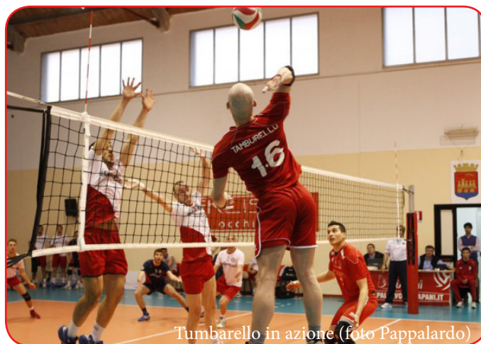
Tumbarello in azione

dopo una battaglia di oltre 2 ore in casa dell' Erice Entello Pallavolo Marsala per 2-3 (25-20, 24-26, 25-20, 16-25, 12-15). Grande risultato per le neopromosse ericine, che