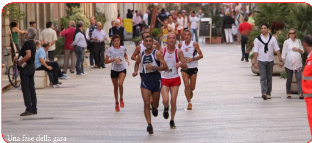
Una fase della gara

La corsa è simbolo di libertà e di benessere, trasformandosi anche nella più facile forma di competizione tra gli uomini. Tali competizioni hanno da sempre trovato terreno fertile