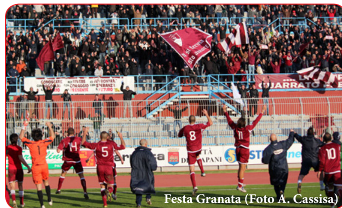
Festa Granata

tezza. Pallavolo e Pallacanestro incombono, ma la quasi contemporaneità degli eventi obbligherà il tifoso granata