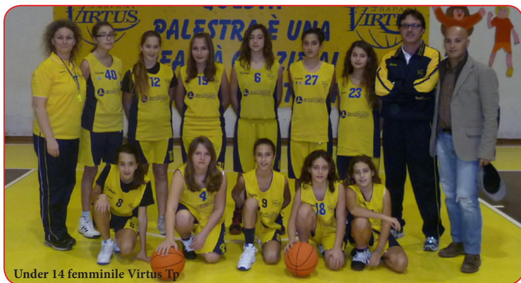
Under 14 femminile Virtus Tp

quasi tutti i campionati maschili, ha il grande merito di allargare i propri orizzonti anche al settore femminile, restando al momento