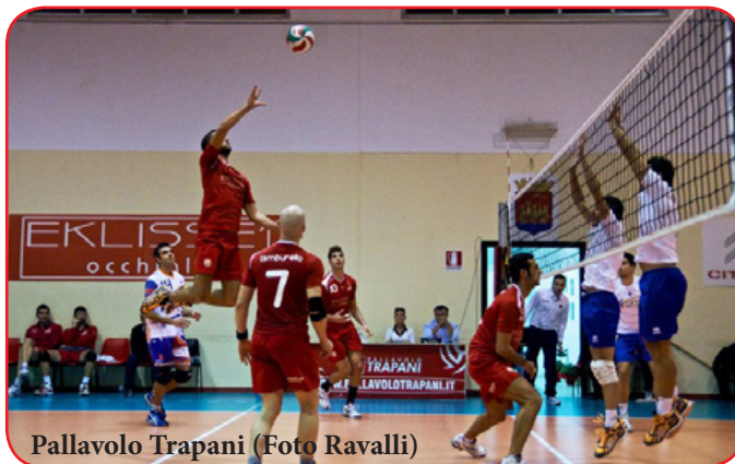
Pallavolo Trapani

facilissima trasferita di Palermo, contro la Futura seconda forza del girone. Superba vittoria della Sicania Erice , che supera in casa nettamente la Caronna Palermo per 3-0 (25-21, 27-25, 25-15).