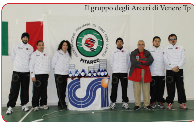
Il gruppo degli Archeri di Venere Tp

limpico seniores maschile, la Pol. Drepano nel compound seniores maschile e della Asd Tirreno e compound master maschile. L'attività degli arcieri trapanesi resta in continuo fermento con tantissime gare ogni settimana in tutta la nostra regione. Il prossimo appuntamento però è ancora a Trapani domenica 3 febbraio all'interno della palestra Cappuccini di via Ranucoli, dove la Pol. Drepano organizza il "3° Memorial Giuseppe Russo".