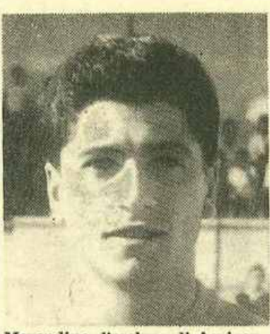
Merendino, l'escudo di Agrigento rientrerà domenica nella partita con il Siracusa.

Si impone, quindi, con urgenza il problema di riempire questo pauroso vuoto e di eliminare questa barriera che ogni domenica sempre di più gli avversari innalzano fra la nostra difesa e l'attacco.