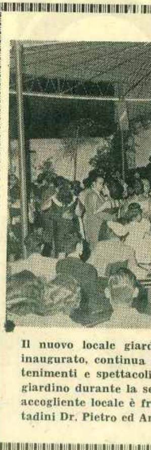
Il nuovo locale giardino «Eden», sito alle Fontanelle, recentemente inaugurato...