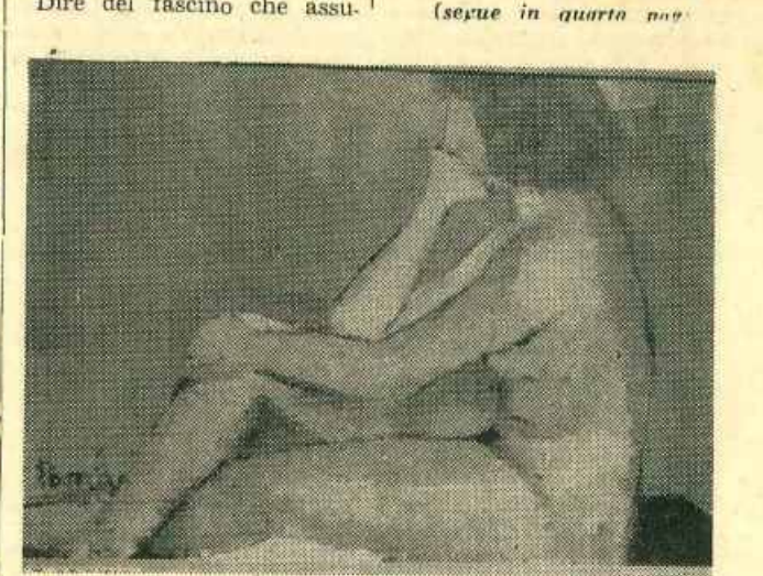
Il quadro vincitore della Prima Rassegna di Pittura