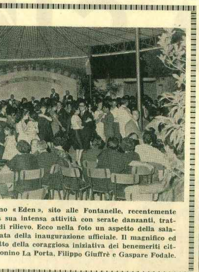
Il nuovo locale giardino «Eden», sito alle Fontanelle, recentemente inaugurato, continua la sua intensa attività con serate danzanti, trattamenti e spettacoli di rilievo...