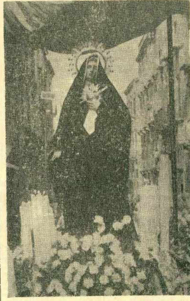
S. G. Madonna Addolorata, ceto dei camerieri