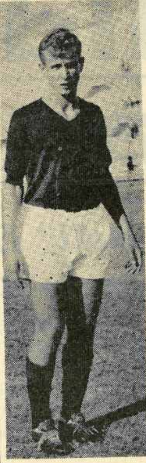
Giugno ha segnato al 32' della ripresa

Alcamo 19 Novembre Mancavano solo due ore all'inizio dell'incontro, e soltanto per linee esterne siamo riusciti a sapere do-