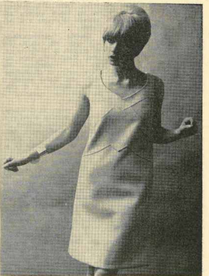
Il messaggio che la moda berlinese ha lanciato per la prossima stagione estiva è un invito ad uno stile romantico e allo stesso tempo pratico.

Da Yves St. Laurent assumono un particolare aspetto «marinaro» accentuato da bottoni dorati che spiccano nelle allacciate a doppio.