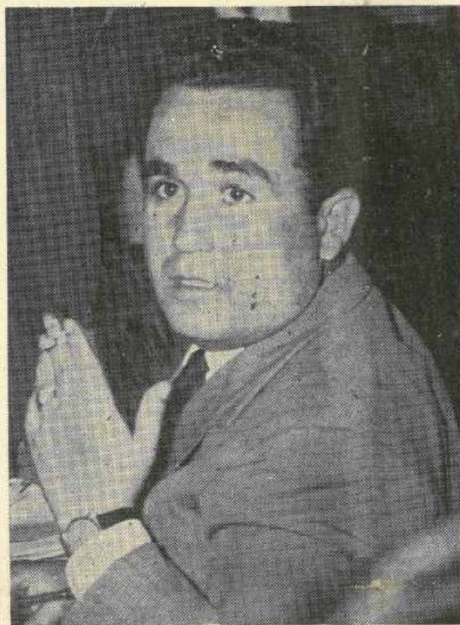
L'ON. NINO MONTANTI

Sostenuta con fermezza e decisione la necessità di urgenti e concreti interventi in favore dell'Agricoltura del Sud nel quadro della politica europea. Per gli agrumi, olio d'oliva, vino e grano duro, capisaldi della nostra attività agricola, una politica di prezzi adeguati per un giusto reddito dei nostri produttori agricoli.