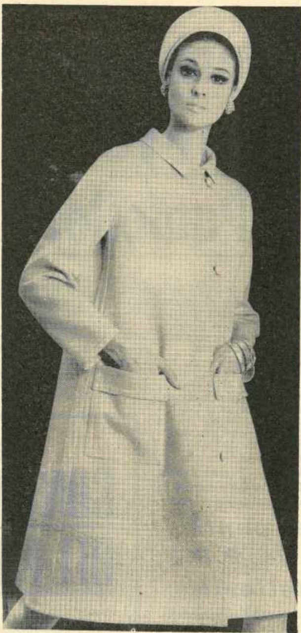
Lo stile «adorabile» collegiale si concilia, nelle recenti collezioni, con la tendenza enuda e più che nudos.

Bianco per i sartí francesi e tedeschi e martingale per gli uomini : regole fondamentali