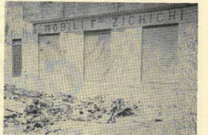
VIA GENERALE AMEGLIO

Pubblichiamo una parte della documentazione fotografica che ci siamo procurati e che dimostra ampiamente gli... ottimi risultati dell'attuale Amministrazione Comunale