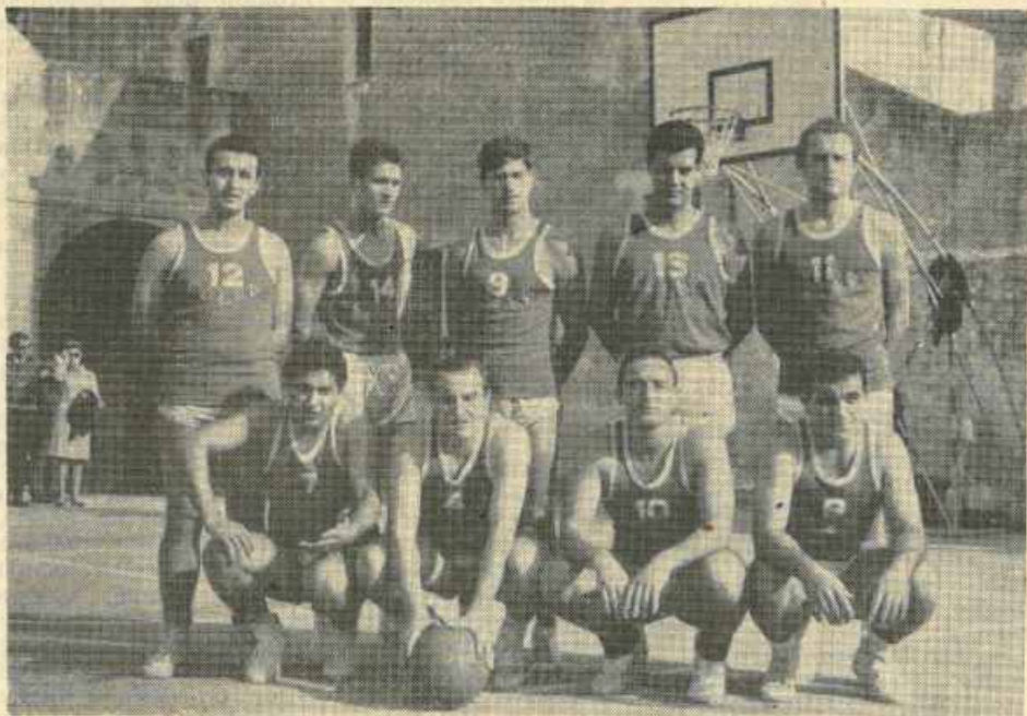
Una formazione ai tempi d'oro dell'EDERA

Il «derby», che si svolgerà nella Palestra coperta «A. Rosmini» alle Fontanelle, alle ore 11, sarà tra i più combattuti dell'intero campionato. L'ingresso come al solito sarà gratuito, allo scopo ancora una volta di attirare quanti più sportivi sia possibile in modo da poter incoraggiare, con scrosciosi applausi, i bravi ragazzi dell'EDERA.