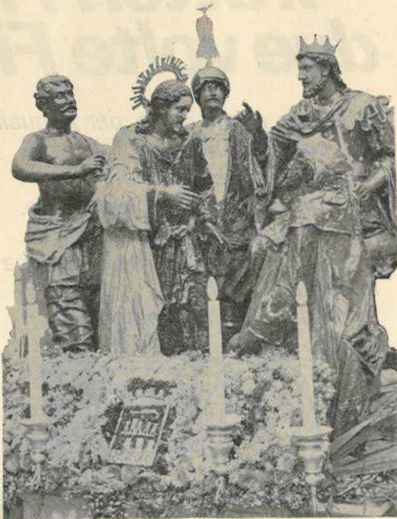
GESU' DINANZI AD ERODE Opera di Baldassare Pisclotta (Ceto dei Pescivendoli)

I gruppi sacri, di valore anche artistico, percorrono le vie del centro durante tutta la notte del Venerdì Santo fra una folla sempre rinnovantesi di fedeli giunti anche dai più lontani centri dell'Isola e del Continente, e dalle terre d'oltremare