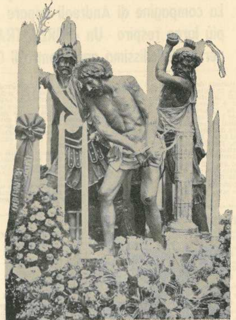
LA FLAGELLAZIONE Opera di Giuseppe Milanti (Ceto dei Muratori e Scalpellini)

Chiesa del Purgatorio (ore 15), Via Gen.le Domenico Gliglio, Corso Vitt. Emanuele, Via Giovanni XXIII, Piazzetta Matteotti (ore 15,20), Via Libertà, Via Torrearsa (ore 15,45), Arco delle Arti, Via delle Arti, Via Barone Sieri Pepoli, Largo della Cuba (ore 16,10), Via della Cuba, Piazzetta Notai, Via Argentieri, Largo S. Agostino, Corso Italia (ore 16,40), Via Api (ore 17,20), Via Giudecca, Via XXX Gennaio, Via Osorio (ore 17,45), Via Spalti (ore 18,10), Piazza Vittorio Emanuele (ore 18,35), Via G. B. Fardella (lato Sud - ore 18,55), Lonero (ore 22,15), Via G. B. Fardella (lato nord), Piazza Vitt. Emanuele, Viale Regina Margherita (ore 0,25), Piazza Vitt. Veneto, Via Garibaldi (ore 0,50), Via Torrearsa (ore 1,35), Casina delle Palme, Piazzetta Lucatelli (ore 2,15), Via Antonio Turreta, Via Nunzio Nasi, Via G. Tartaglia, Largo San Francesco D'Assisi (ore 3,20), Via Corallai, Corso Vittorio Emanuele, Piazza Gen.le Scio (ore 3,55), Via Cappuccini, Via Cristoforo Colombo, Via Giovanni Da Procida, Via Carolina, Piazza Gen.le Scio, Corso Vittorio Emanuele (ore 5), Via Antonio Turreta (ore 6,30), Piazzetta Lucatelli, Via San Francesco D'Assisi, Chiesa del Purgatorio (ore 7,30).