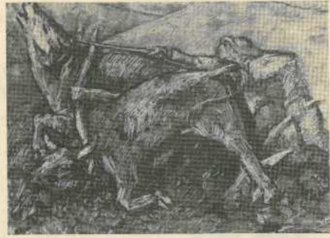
Un quadro di Domenico Li Muli, noto scultore e incisore maestro, oggi direttore del Museo Pepoli

niente di tutto questo e, senza che lo me lo aspettassi, Wilma mi baciò. «Ma sei impazzita?» le gridai nel buio.