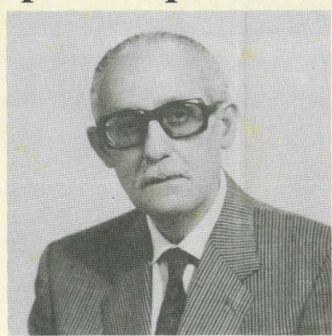
IL SEN. GIUSEPPE PERRICONE

ri all'ottanta per cento del salario convenzionale del settore di appartenenza. Per esempio, le donne impiegate nel settore agricolo avranno diritto ad una indennità calcolata su un salario medio convenzionale di 686.400 lire. In più il decreto è stato esteso anche nel caso di adozione di un minore, sempre che abbia un'età inferiore ai sei anni. Ma la novità più importante è questa: l'indennità verrà anche corrisposta, ma solo per un mese, anche nel caso di aborto spontaneo o terapeutico, con la sola condizione che si verifichi dopo il terzo mese di gravidanza.