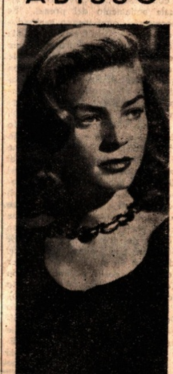
Lauren Bacall, come la vedremo nel film "Abisso", che si gira in questi giorni ad Hollywood

Stannotte tutti al Balio per l'elezione di Venere Ericina