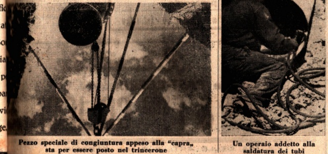
Pezzo speciale di congiuntura appeso alla "capra", sta per essere posto nel trincerone

Ma il quadro non è stato meno degno della cornice! Al richiamo di tanta folla ha contribuito la bontà delle manifestazioni e la larga partecipazione degli atleti. Come infatti potere rimanere lontani dall'assordante carosello di centinaia che durante i 50 giri del percorso ha entusiasmato una folla che si valuta a più di 20.000 persone?