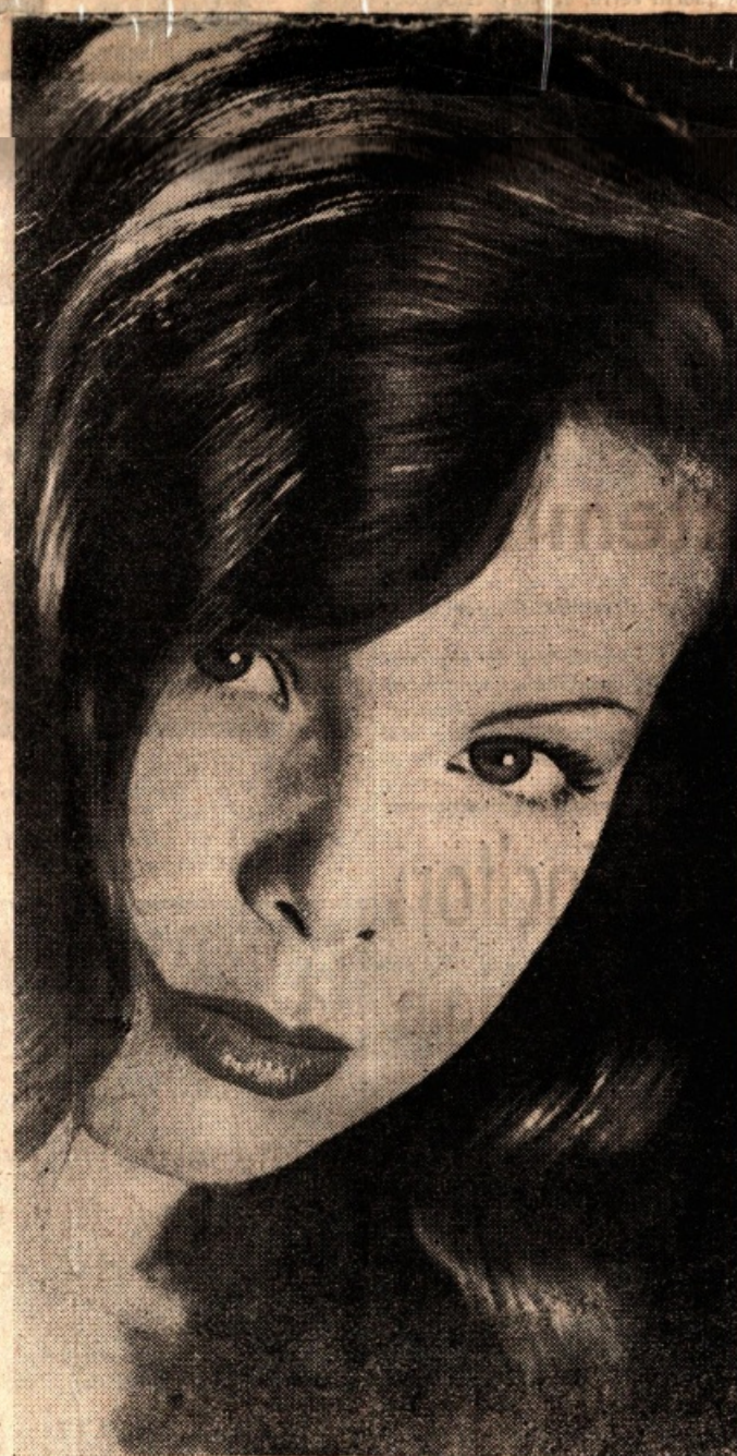
Cecile Aubry nuova stella di Hollywood