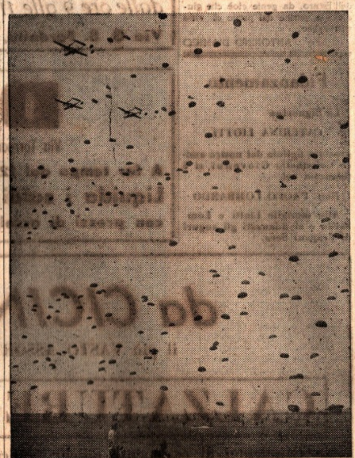
Un'azione di paracadutisti americani