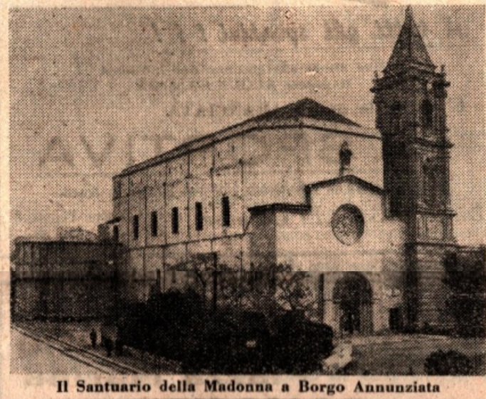
Il Santuario della Madonna a Borgo Annunziata

La celeste Regina rimane però sempre in mezzo al suo popolo, per accoglierne le preghiere, per lenire le sue pene