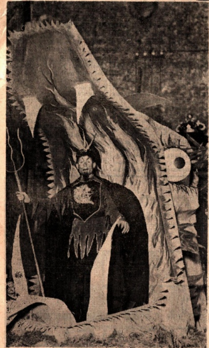
Terzo gruppo: «Il Genio del male»