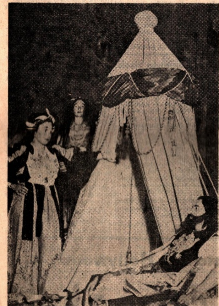
Secondo gruppo: «Giuditta dinanzi ad Oloferne»