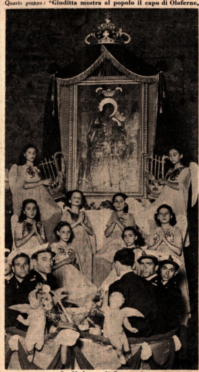
La Madonna di Custonaci