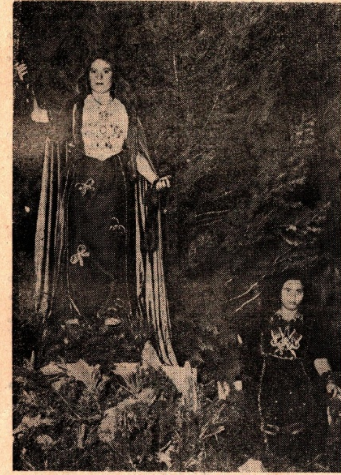
Primo gruppo: «La Schiavitù e la Libertà»