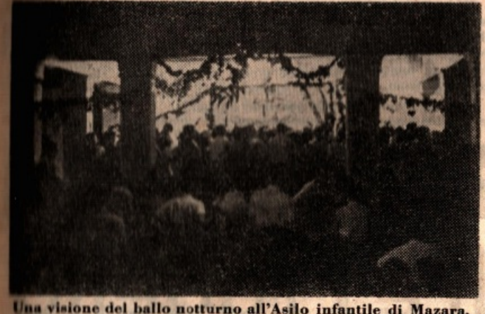
Una visione del ballo notturno all'Asilo infantile di Mazara, protrottasi fino all'alba