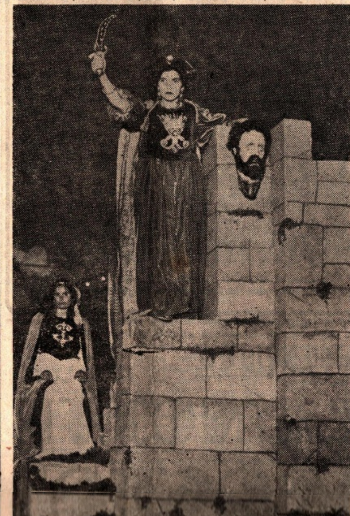
Quarto gruppo: «Giuditta mostra al popolo il capo di Oloferne»