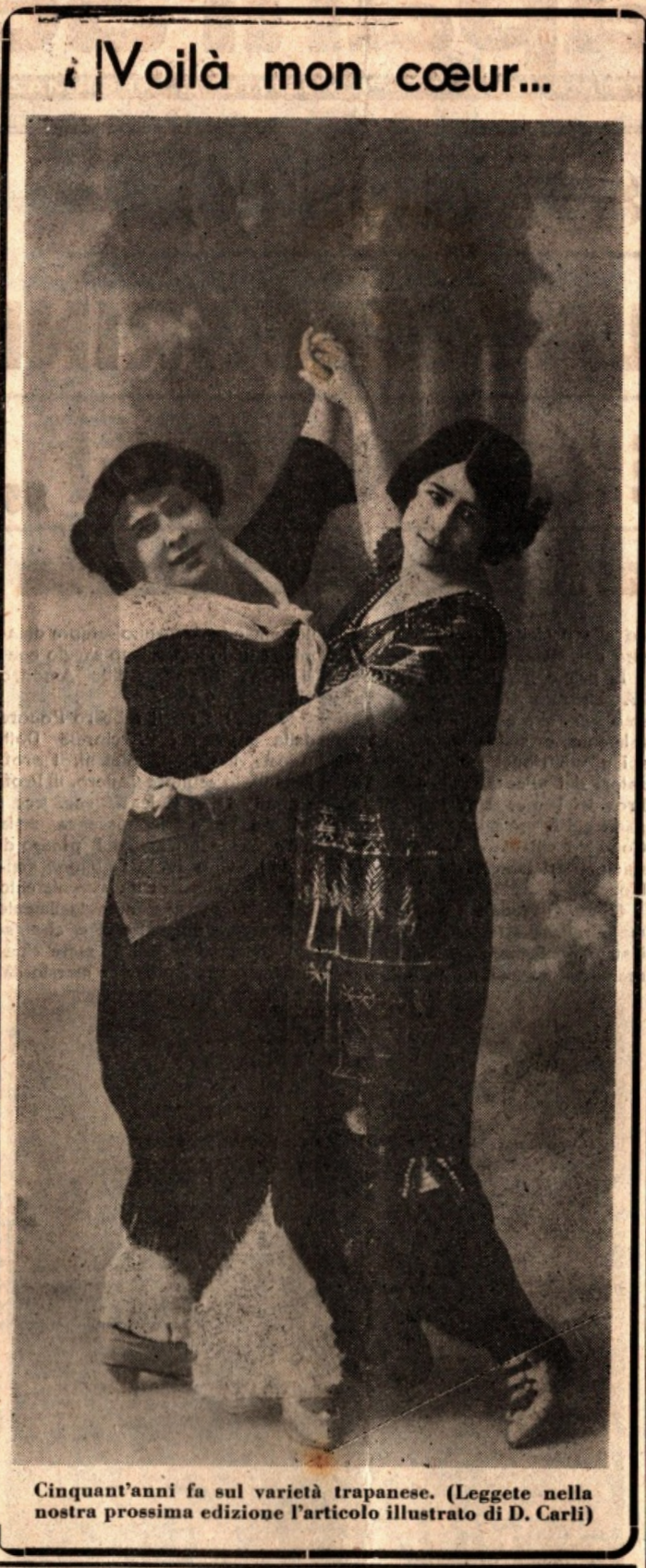
Cinquant'anni fa sul varietà trapanese. (Leggete nella nostra prossima edizione l'articolo illustrato di D. Carli)

La circolare della CRI porta a margine la seguente dicitura: "Anche la carta del vostro cestino può contribuire alla salvezza di una vita umana."