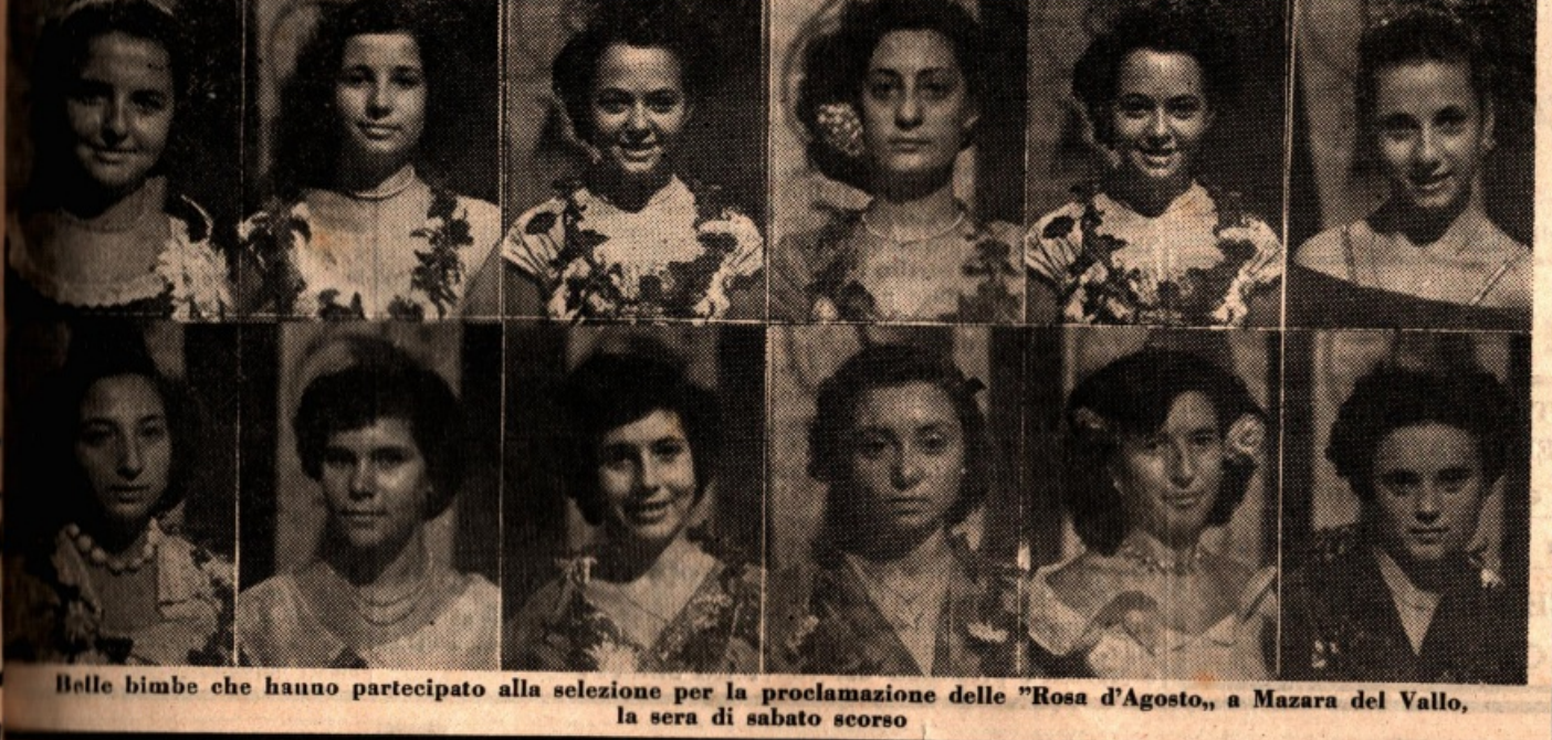
Belle bimbe che hanno partecipato alla selezione per la proclamazione delle "Rosa d'Agosto", a Mazara del Vallo, la sera di sabato scorso