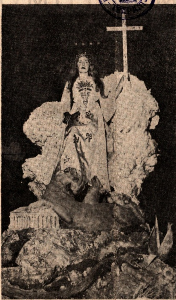
"Il Trionfo della Chiesa", uno dei gruppi della Processione dei Personaggi ad Erice. (Leggere l'articolo in quarta pagina.)

È un auspicio, ma nutriamo fiducia che sarà realizzata la ri-