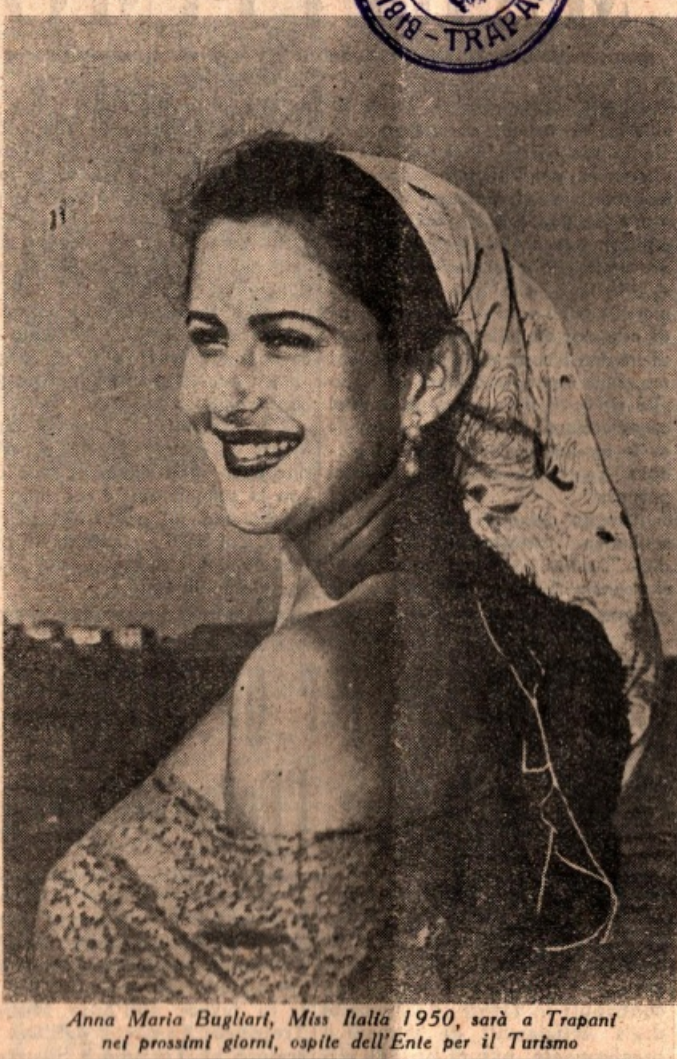
Anna Maria Bugliari, Miss Italia 1950, sarà a Trapani nei prossimi giorni, ospite dell'Ente per il Turismo

Questo giornale che è nato appunto per promuovere ed incrementare il benessere ed il progresso materiale e spirituale della nostra Trapani, crede di svolgere opera altamente utile e meritoria additando alla conoscenza ed all'ammirazione dei Trapanesi i gemme preziose che la loro città racchiude.