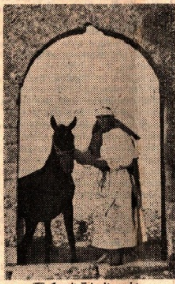
Assalto degli arabi