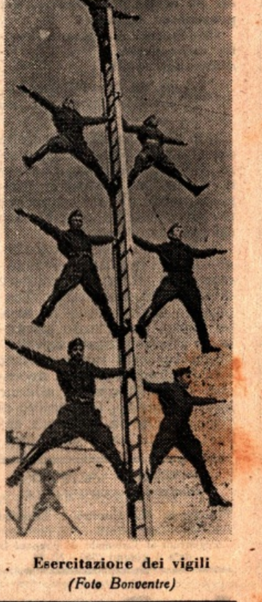
Esercizio dei vigili