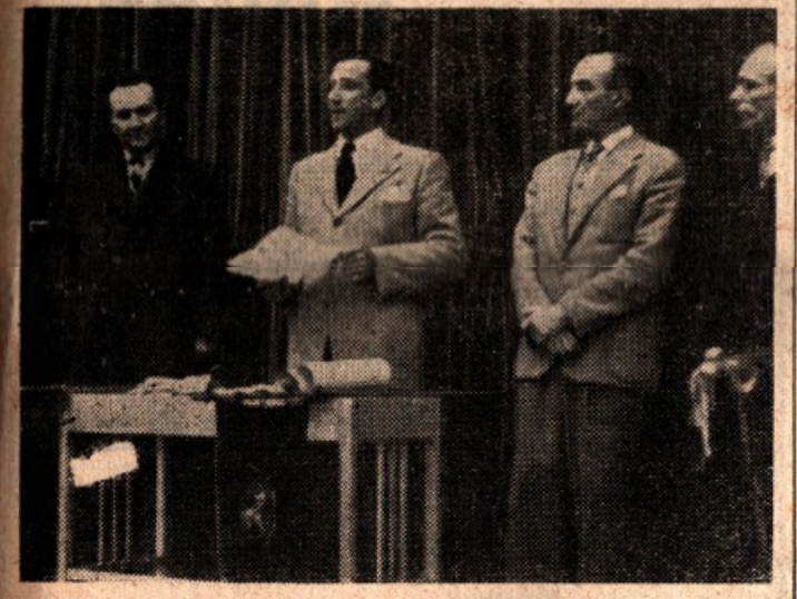
Durante la cerimonia, all'Ariston