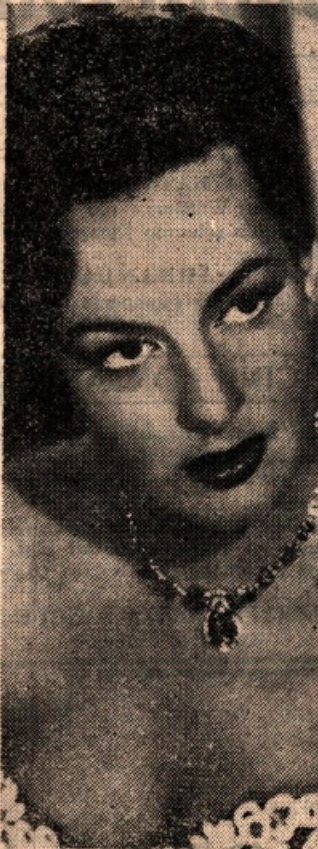
nel film "L'inafferrabile 12... in programmazione al Cinema Ideal nella prossima settimana.