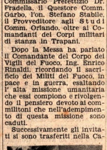
Parla il Comandante dei Vigili del Fuoco

serma dei Vigili del Fuoco, dove hanno assistito ad una brillante esercitazione antincendio, durante la quale i bravi Militi sono stati calorosamente applauditi.