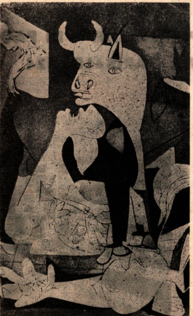
Pablo Picasso: Guernica

Nel fenomeno Picasso invece il pubblico domenicale, volente o nolente, è uno dei principali pilastri su cui poggia la gloria dello spagnolo. Questo pubblico, che alle mostre d'arte moderna fa il gastigamati e il distruttore e non si spaventa di ridere o addirittura sghignazzare, quando si trova invece faccia a faccia con le frenetiche invenzioni del nuovo idolo sbalordisce e si guarda in giro confuso. Questo pubblico non sa, in sostanza, come si deve comportare ma, in ogni caso, non ride e soprattutto non chiede (ed è appunto questo un fenomeno) schiarimenti, non domanda ai critici il motivo intimo dei loro entusiasmi. Anche se internamente è roso da un dubbio se lo tiene per sé, nascosto nel proprio intimo, come un pensiero impudico. Poi torna ai propri affari, all'officina, al cantiere, all'ufficio, ma i quadri e i disegni di Picasso gli rimangono impressi nel cervello, come un incubo, e alla prima occasione, ne parla con gli amici, coi colleghi, coi compagni di lavoro. Il nome di Pablo Picasso è così sulle bocche di tutti fa il giro del mondo, tutti lo conoscono, lo citano o ne hanno sentito parlare. La popolarità è fatta.