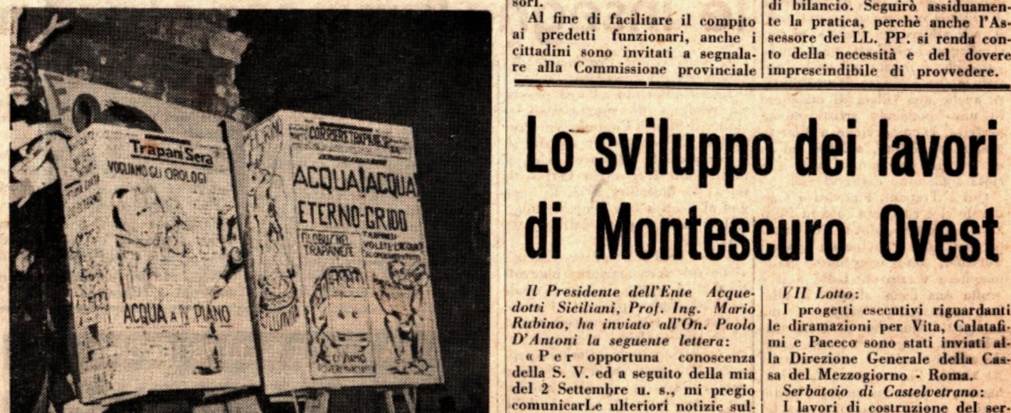
Martedì 6 febbraio ha avuto luogo in Piazza S. Agostino, la premiazione delle migliori maschere.