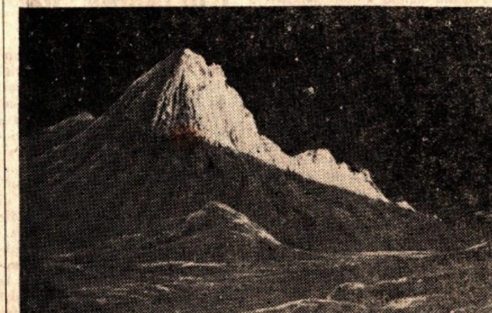
Il monte Huygens, alto 5.500 metri, nel disegno di un artista terrestre