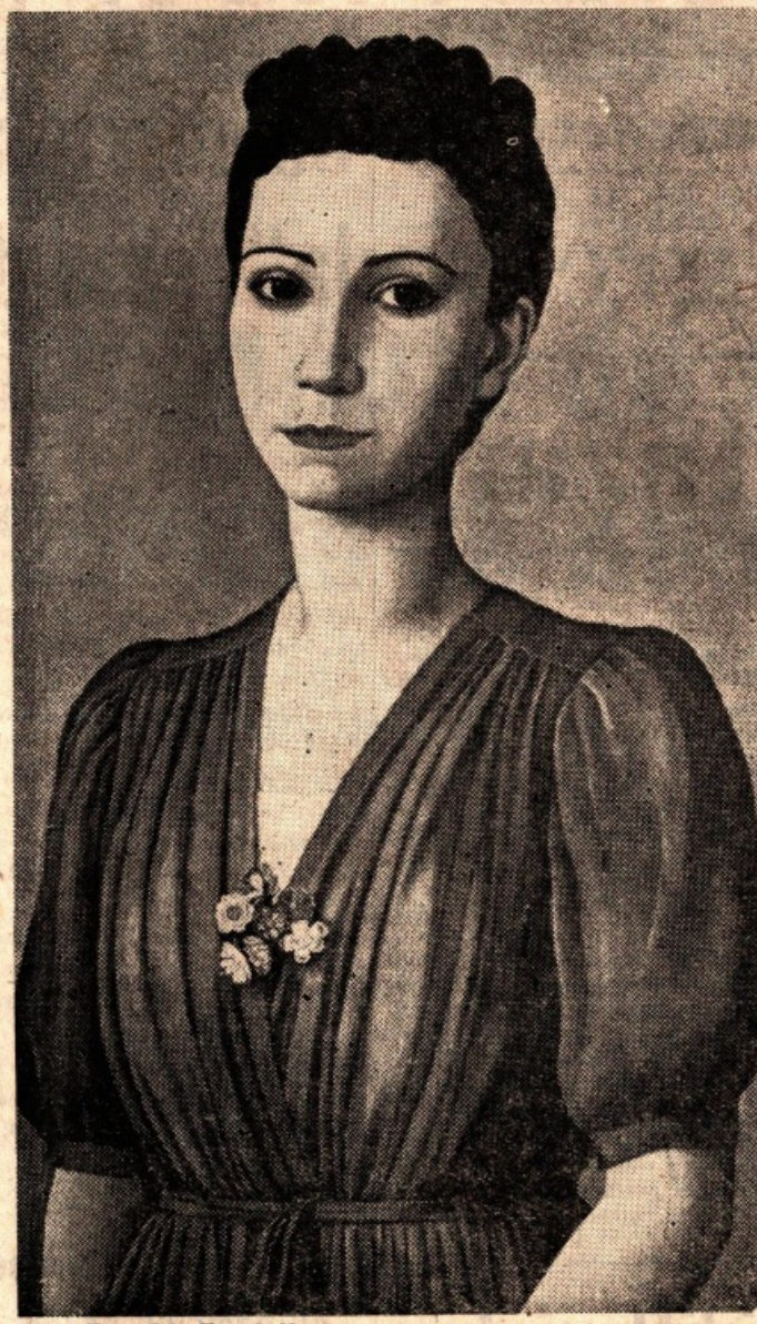
A. Donghi: Fanciulla