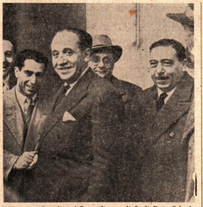
L'Assessore Castiglia col Provveditore agli Studi Dott. Orlando e coll'On. Grammatico, durante la visita ad un plesso scolastico

TRAPANI, 7. Nella corrente settimana la provincia di Trapani è stata visitata dall'Assessore Regionale alla Pubblica Istruzione, On. Castiglia, che è venuto in mezzo a noi per rendersi personalmente edotto delle esigenze e delle necessità della Scuola trapanese.