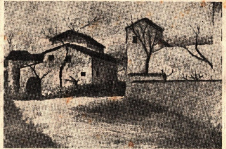
Quando la polemica tace, il temperamento lirico di Rosai si manifesta in pieno; ne pubblichiamo un validissimo esempio.