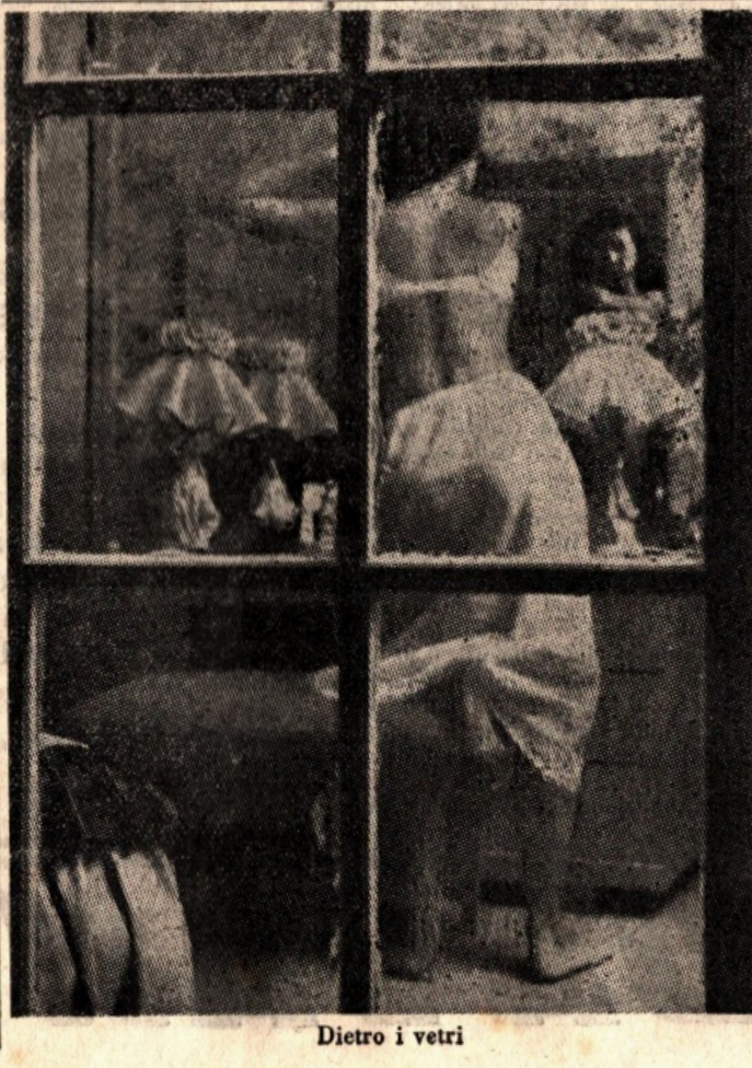
Dietro i vetri

Chi salga al teatro, dopo aver attraversato una porta dell'antica cinta di mura, percorre un terreno tutto disseminato di sassi grossi e piccoli: non c'è bisogno di essere un provetto archeologo per comminare guardando la punta delle scarpe invece della volta celeste, e se n'è andato lassù, in purità d'animo ed in semplicità di spirito, a godere una luce sole fragranza grida di bimbi felicità di genti ignare; sogni ad occhi aperti. Proprio così: sogni ad occhi aperti. Giacché, per quanto grande possa essere la nostra capacità ricostruttiva, qualunque fantasia noi creiamo dell'antica Segesta sarà sempre un nostro sogno: la realtà di oggi — un deserto — è tale che nemmeno un villoggio potrebbe vivere colà; e se una città vi fiorì, vuol dire che trenta secoli fa le condizioni erano diverse o l'esistenza della città le aveva rese diverse. Pochi sono gli elementi che il luogo ci fornisce: un teatro, una cinta di mura, un tempio, una grotta sacra, il torrente, colline a grano ed a vitigno, la non lontana Jeracissima valle sotto l'odierna Calatafimi.