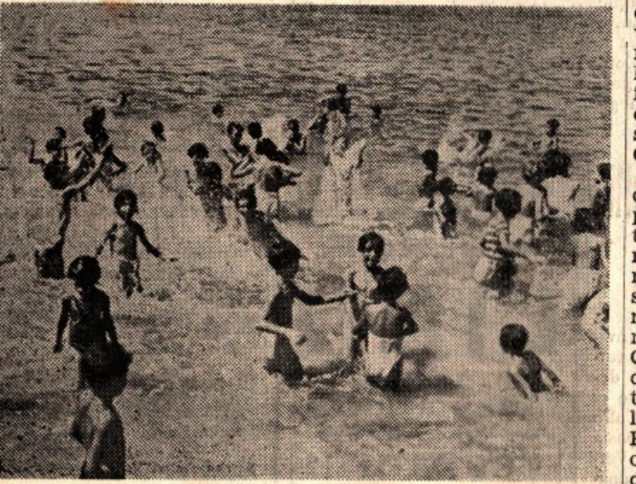
Nella magnifica spiaggia di Porticello, dove sono trasportati quotidianamente a mezzo di comodi autopullman, i bimbi trascorrono ore felici e godono dei benefici influssi del mare e del sole.