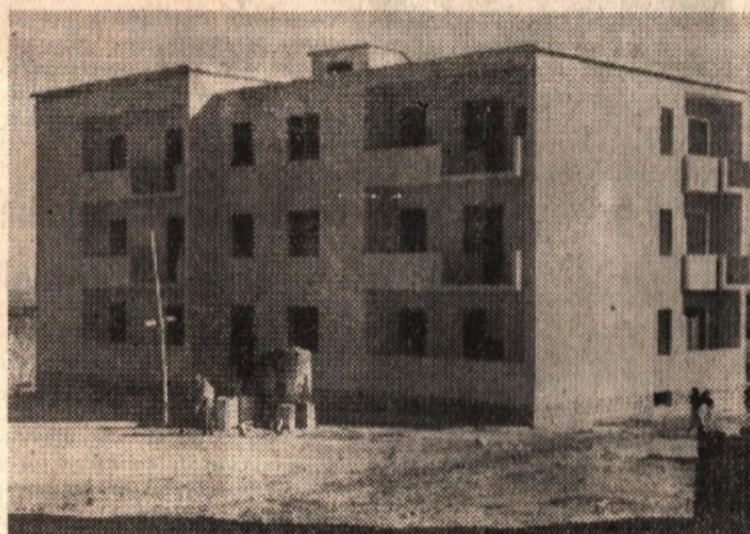
Sorgono le case per i lavoratori

TRAPANI, 12. Dopo aver visitato i capannoni delle ex caserme «Garibaldi», «Sant'Anna», e «XXX Gennaio», che ospitano le famiglie dei senzatetto trapanesi, a seguito di varie inchieste da noi compiute, onde accertare le reali esigenze e le inderogabili necessità dei nostri sinistrati di guerra, nello scorso mese di Novembre abbiamo fatto il punto sulla non invidiabile situazione degli sfollati trapanesi.