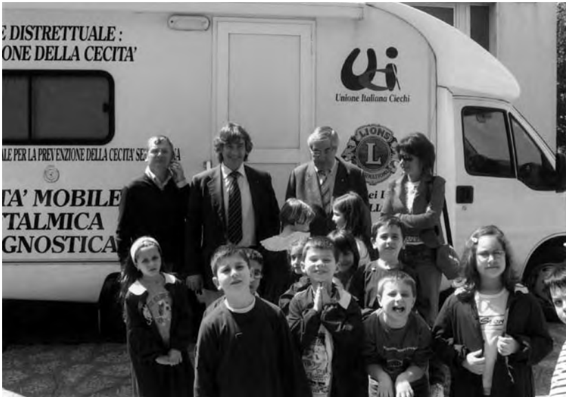
Progetto Sight First