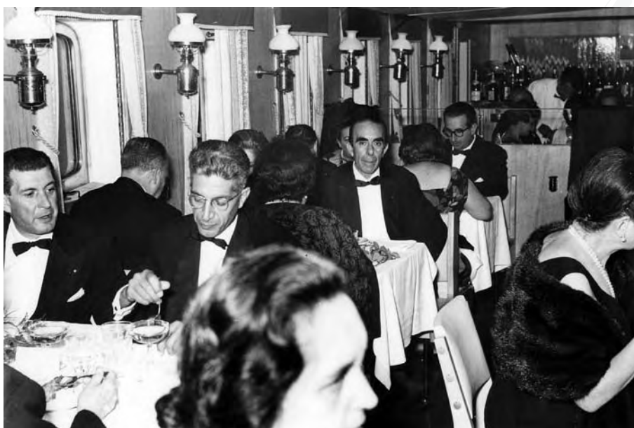
Manifestazione conviviale sull'Antonello da Messina. Anno sociale 1966 - 67