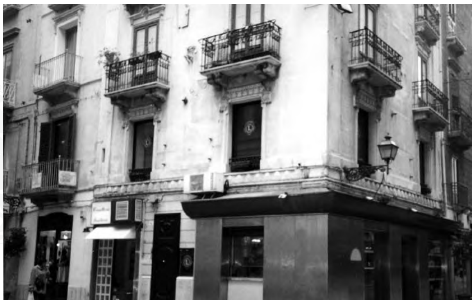
La nostra sede in Corso Vittorio Emanuele