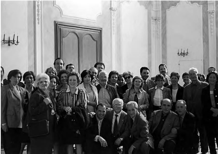
Momento di aggregazione