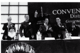
«Domenico dobbiamo fare questo», è il giorno seguente viene realizzato perché la nostra Associazione è libera e opera in maniera indipendente. Un pensiero va poi alle donne che Grimaldi spera possono essere sempre più numerose e assicurare incarichi sempre più prestigiosi.

Registriamo il saluto ai congressisti da parte delle autorità civili e lionistiche. Finalmente è la volta del Governatore Domenico Messina che dichiara subito di avere grandi responsabilità nel portare avanti il programma e nel guidare tutti i 93 club che avrà il piacere di incontrare personalmente. Si sofferma a parlare con orgoglio della sua città: Trapani, ricca di storia millenaria e conosciuta nel mondo per il sale e i mulini che sono diventati il suo motto e il suo logo. Pasa a tutti quando, col cuore, dice che dobbiamo stare insieme, perché insieme si può andare avanti meglio, che poi è il fine dei lions, che da 85 anni sono al servizio dell'umanità. Bisogna scendere dal piedistallo e stare tra la gente, continua con forza, ascoltare i loro bisogni e cercare, senza pretese impossibili, di dare un aiuto concreto a chi ne ha veramente bisogno. Cita poi George