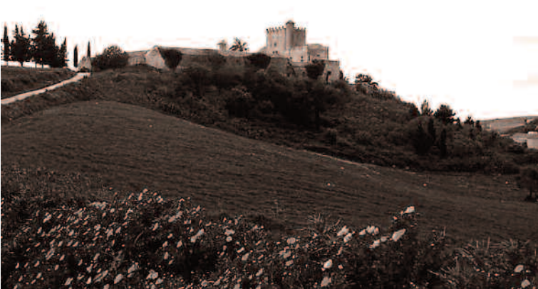
Panorama di Ballata con veduta del Castello Maurigi

A Ballata più che altrove si colgono gli aspetti della natura, i suoi ritmi, l'eterno immutabile cielo legato all'alternarsi delle stagioni. In questa ridente collina dell'Agro ericino ho vissuto fino all'età di nove anni. Sulla parte più alta sorge il castello Maurigi. Vicino una chiesa del '600. Ho sempre immaginato un'angolazione dove sia possibile ritrarre una parte della pineta, luogo delle mie passeggiate e giochi: cercherei di riprodurre quanto più possibile i colori naturali tipici della primavera. In pineta con gli aghi di pini facevamo, io e le mie amichette, lunghe collane e corone di fiori che mettevamo fra i capelli. A Ballata ho assaporato il piacere di un frutto appena colto dall'albero, l'odore dei cibi genuini che proveniva dalle cucine a legna, le volute di fumo che si levavano