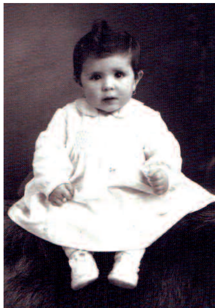
Io a otto mesi