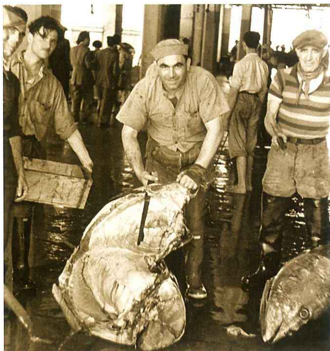
a sinistra Uomo che taglia il tonno