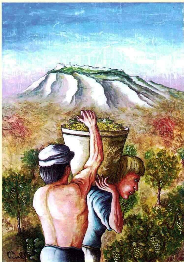
Vito Criscenti Dovital Campagna Ericina – Olio su tela 50x70 Pinacoteca Comunale di Buseto Palizzolo