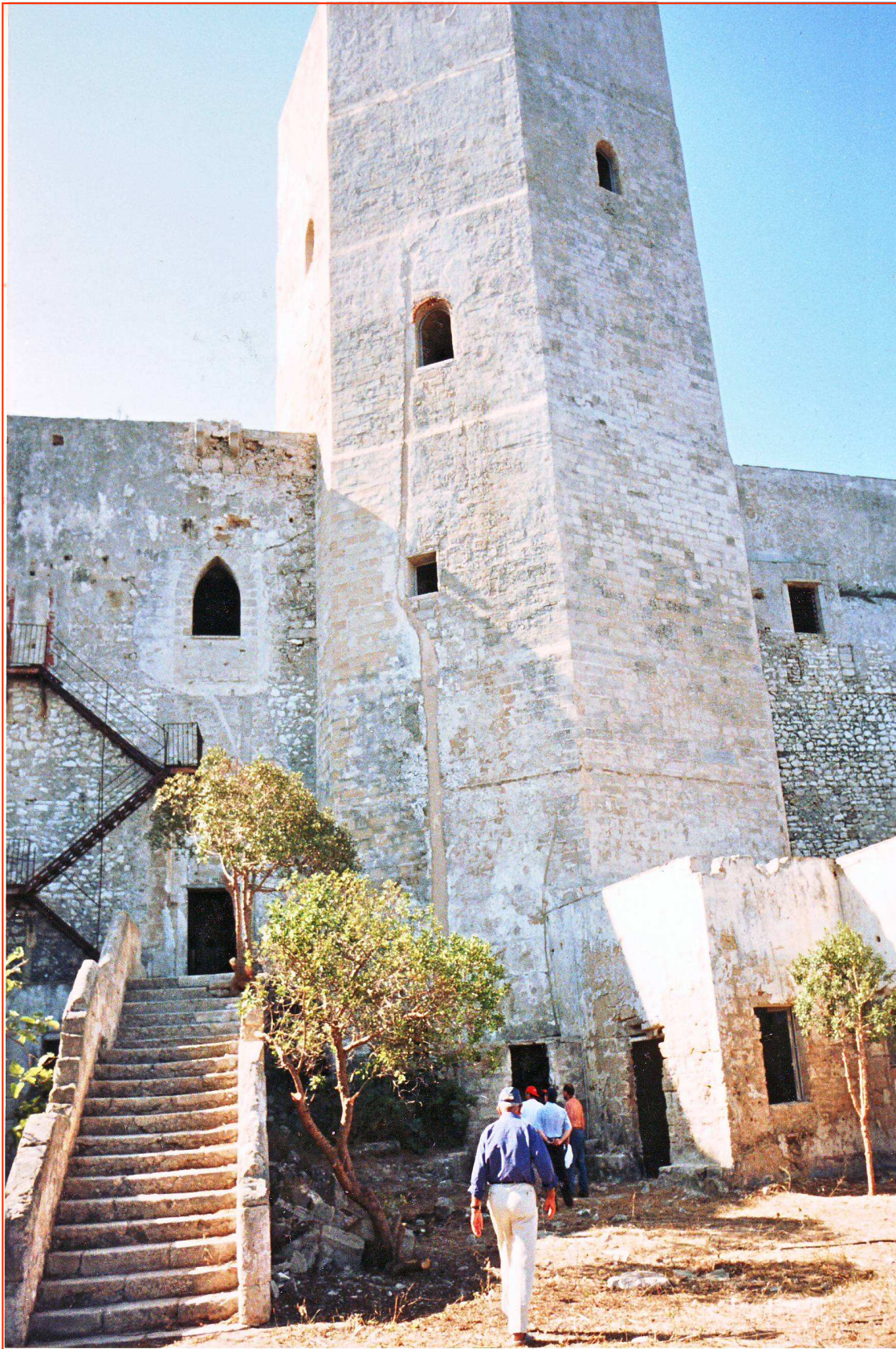
Ingresso - anno 2004