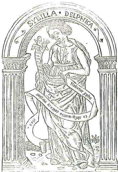
Sibylla delphica uestita ueste nigra et capillis circū ligatis capiti in maū cornu tenēs et iuueis quæ ante troiana bella uaticinata ē de q̄ Chylspp o ait Nascetur ppheta absq matris coitu ex uirgine eius