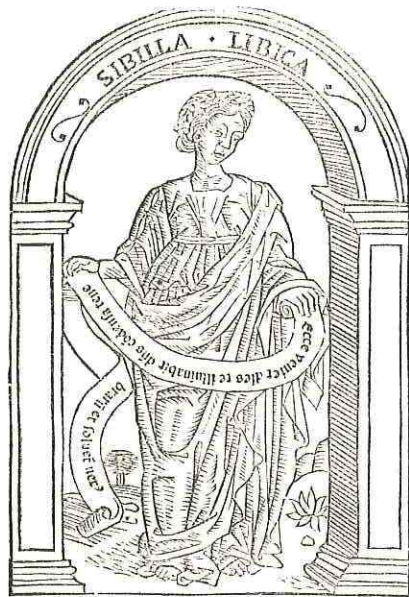
Sibylla libyca ornata seruo uiridi et floz i capite uestita palio honesto et nō multū iuueis. sic ait: Ecce ueniet dies: et illuabit domin o cōdēsa tenebras et soluēt nexus synagoge. et definēt labia hoim: et uidebūt regē uiuētū. tenebit illū i gremio uirgo domina gētiū: & regnabit i miseriacor