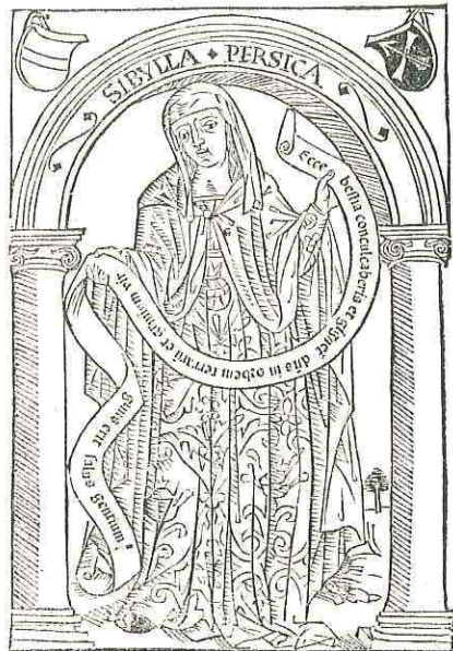
Sibylla persica uestita ueste aurea cū uelo albo i capite. Dicens sic Ecce bestia cōcubaberis et gignetur dominus in orbē terrarū. et gremiū uirginis erit sal o gētiū. et pedes ei o i ualitudie hominum