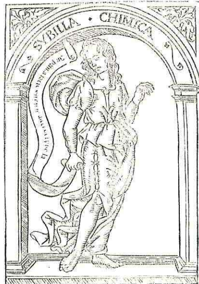
Sibylla emerita i Italia nata alias Chimica uestita celestia ueste deaurata capillis p scapulas sparsis et iuueis de q̄ Ennius ait. In priā facie uirgis ascēdit puella pulchra facie plixa capillis: sedens sup sedē strātā nutrit puerū dans ei ad comedendum aus propriū id est lac de celo missum