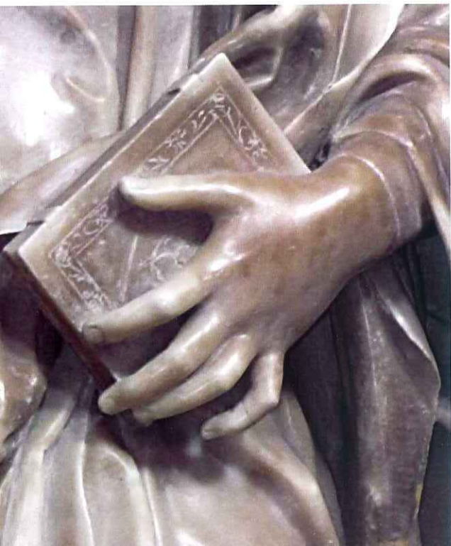
Antonello Gagini Sant'Oliva , particolare della mano e statua, 1511, Chiesa di Sant'Oliva