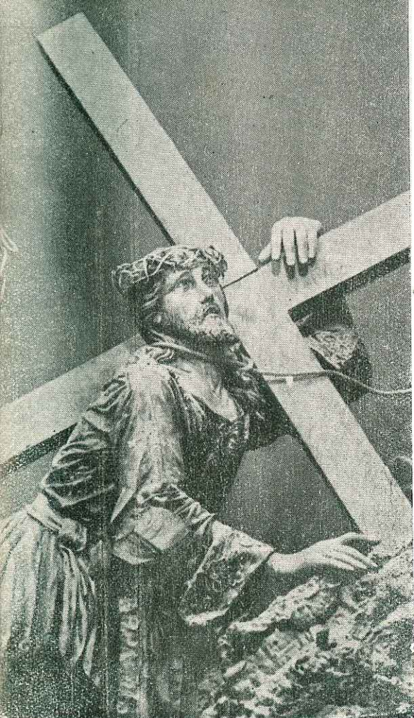
La dolorante figura del Cristo (Particolare del 15° Mistero)