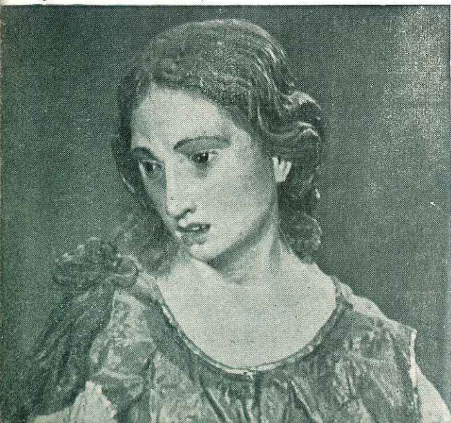
L'espressivo volto della Maddalena (Particolare del 18° Mistero)

Dobbiamo alla magica opera di restauro compiuta da Giuseppe Cafiero se anche questo Gruppo, estratto in frantumi dalle macerie della Chiesa di S. Michele, è ancora una volta rinato alla vita dell'arte e della fede.