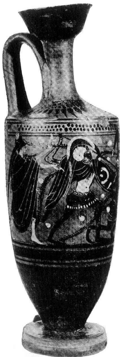
Lekykos a figure nere con scena di combattimento da Selinunte. (Fine del VI Sec. a. C.)