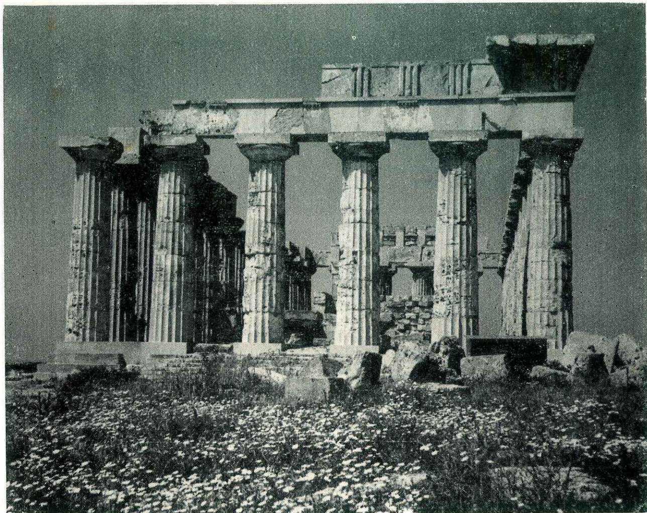
Selinunte - Il Tempio «E»

Ente Provinciale per il Turismo di Trapani