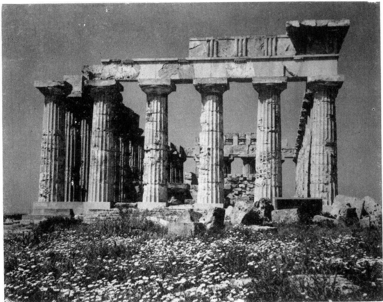
Selinunte - Il Tempio « E »

Ente Provinciale per il Turismo di Trapani