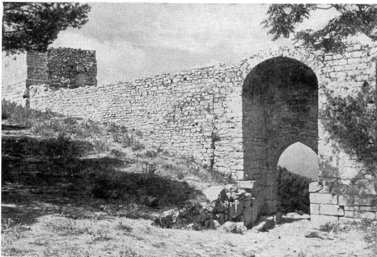
Erice: la medioevale «Porta Spada» nelle mura fenicie

Ente Provinciale per il Turismo di Trapani