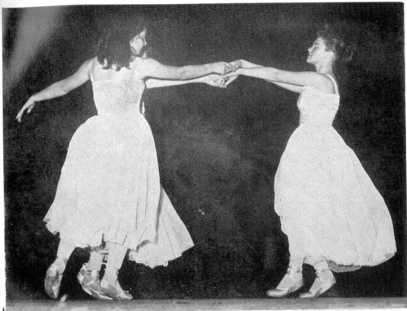
Selinunte - Balletti classici

Ente Provinciale per il Turismo di Trapani